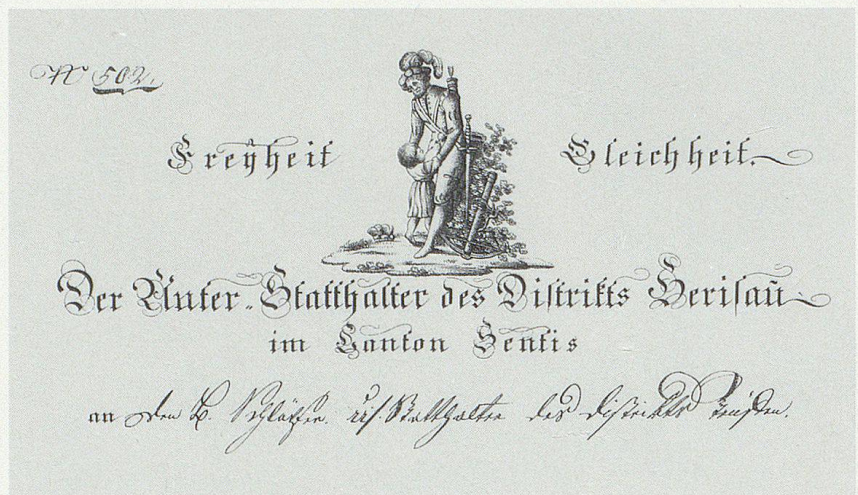
Briefkopf für Korrespondenz des Herisauer Unterstatthalters mit Telldarstellung und Losungsworten Freyheit – Gleichheit, 1800.