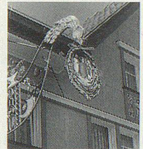
Willkommen in Oberegg AI