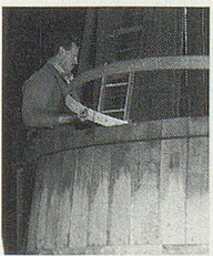
Wie entsteht ein 5000-Liter-Fass?