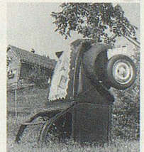
Originelles Denkmal in Reute AR