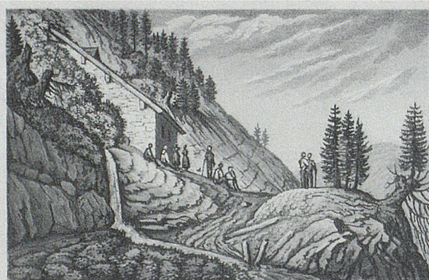
Die St. Jakobs-Kapelle am Kronberg. L'or Chapelle de St. Jacques près de Kronberg.

Die einst durch Geleitbriefe und Bescheinigungen legitimierten oder an speziellen Abzeichen erkennbaren Pilger genossen besonderen Rechtsschutz und hatten Anspruch auf die Werke der