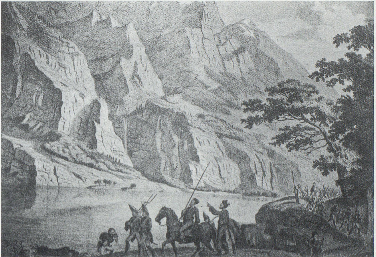
Die Armee Suworows am Klöntalersee, 29. September 1799. Radierung von Ludwig Hess 1760–1800, im Besitz der Stadtbibliothek Zürich.

Wohnhäuser einzudringen und mitzunehmen, was nicht niet- und nagelfest war. Um sich zu erwärmen, verbrannten sie Holz, das von Scheunen und Umzäunungen stammte. In der heute noch erhaltenen Klosterchronik steht zu lesen: «Wir mussten auch für russische blessierte 20 Maass weyn schicken und viel alten Leinwand. Auch haben wir vielen Soldaten Fleisch und Fleischbrüy gegeben.»