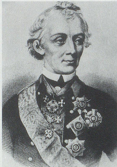
Generalfeldmarschall Graf Alexander Suworow-Rymynskij (24. November 1729–18. Mai 1800) nach einem alten Stich im Restaurant «Teufelsbrücke» in der Schöllenschlucht.

Am 15. September formierte sich Suworow mit 14 000 russischen und 7000 österreichischen Soldaten beim Dorf Taverne am