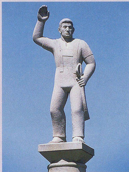
Eidschwörender Landsgemeinde- mann.