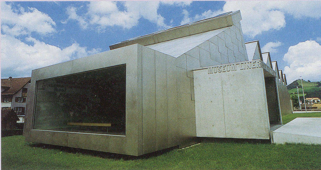
Das 1998 eröffnete Museum Liner.