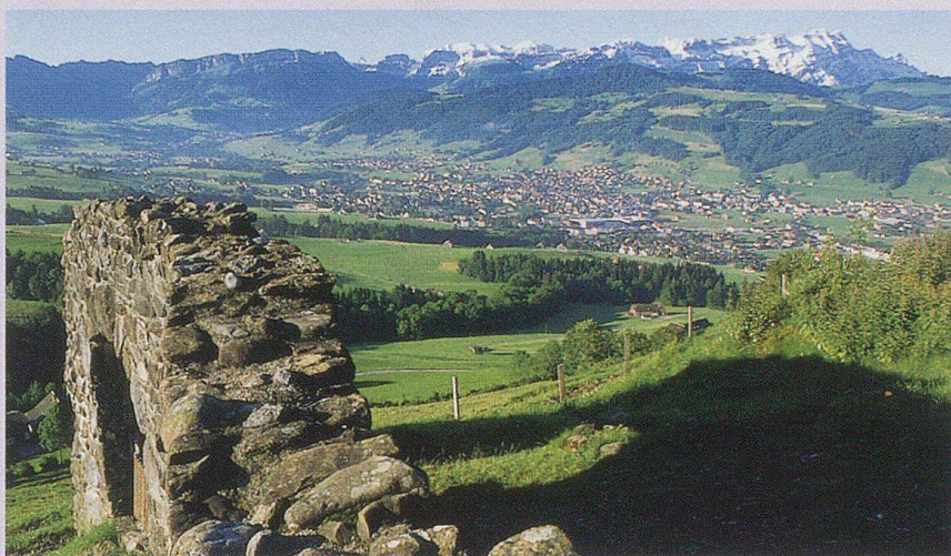
Blick von der Bergruine Clanx aus auf Appenzell und Sämtis.