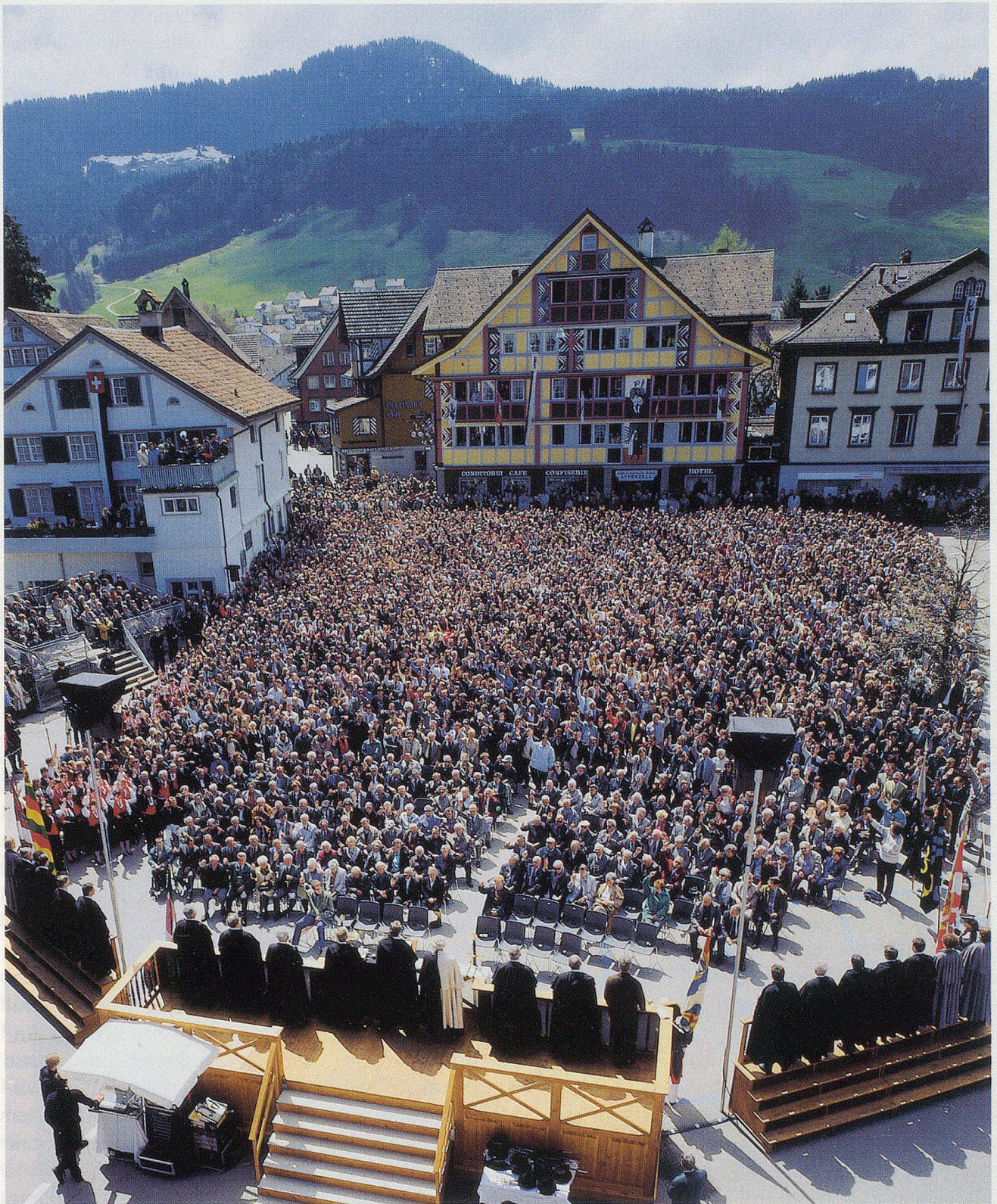
Innerrhoder Landsgemeinde in Appenzell.