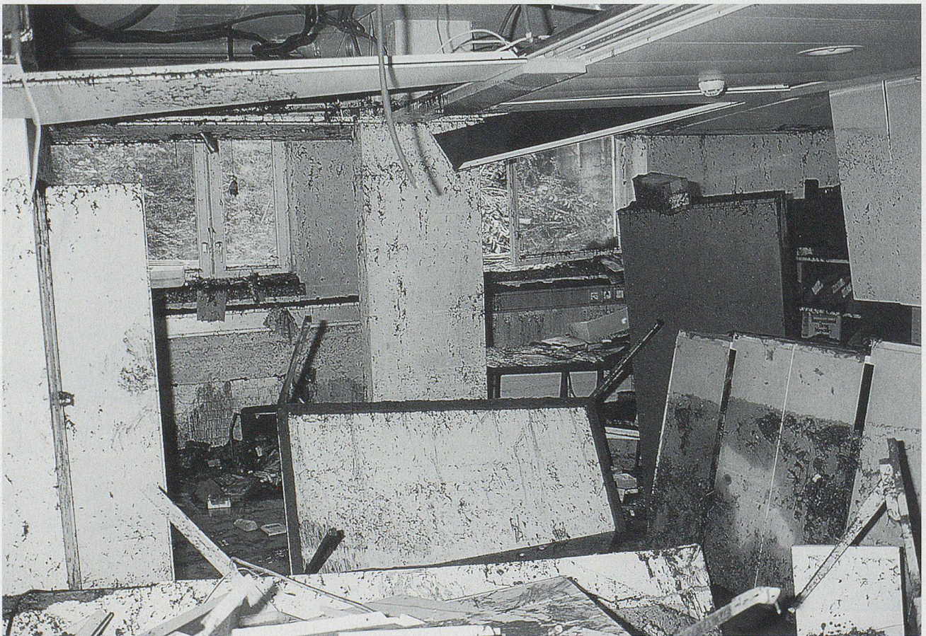
Das Unwetter vom 3. Juli richtete immensen Schaden an. Hier die verwüstete Apotheke des Spitals Heiden.

Ein schweres Unwetter ging am Freitag, 3. Juli, über die Region Vorderland nieder. In Heiden trat der Werdbach über die Ufer und suchte sich seinen Weg durchs Dorf. Er hinterliess Schä-