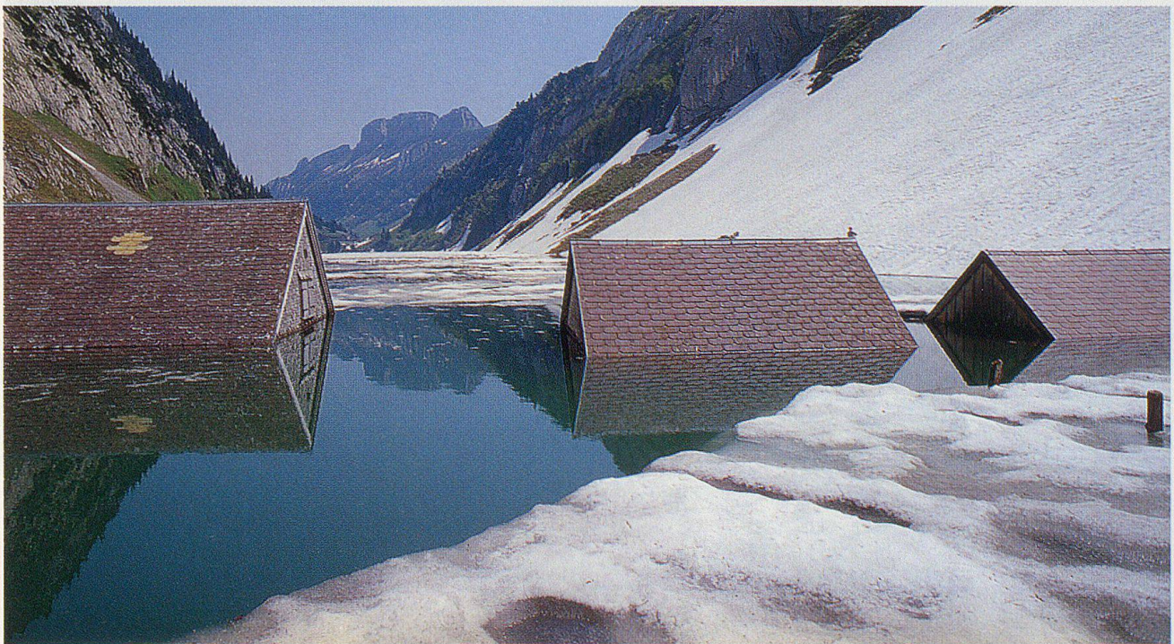
Die Schneeschmelze nach dem intensiven Winter und die starken Regenfälle im Mai führten zu Hochwasser im Alpstein. Der Spiegel des Fälensees lag um vier Meter über dem Normalstand. Die Ställe wurden überschwemmt.

Wie die Säntiswettermänner gegenüber dem Kalendermann erklärten, werde die höchste Schneemenge immer Ende April oder Anfang Mai gemessen,