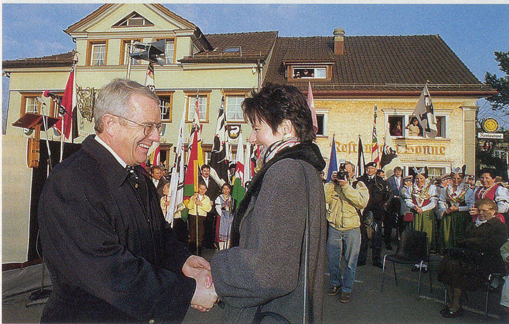
Die Feier begann im Sammelplatz: die neue Bundesrätin Ruth Metzler als Nachfolgerin von Arnold Koller.