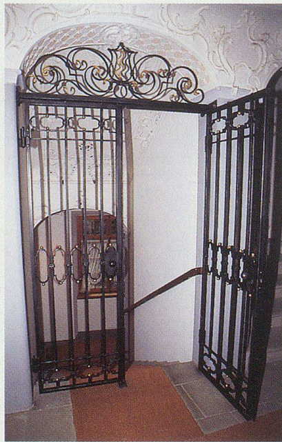
Ein Gittertor trennt das Treppenhaus des Pfarr- und Gemeindehauses am Trogner Landgemeindeplatz von den Räumen der Kantonsbibliothek.