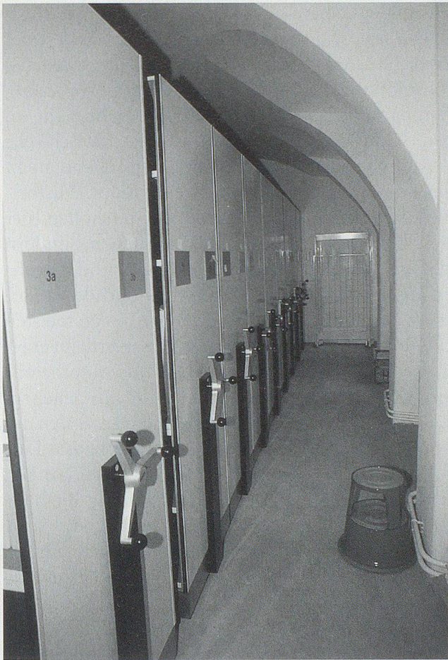
Rollregalanlage im Sockelgeschoss des Fünfeckhauses: «Heimat» für Zeitungen, Zeitschriften, Kalender.