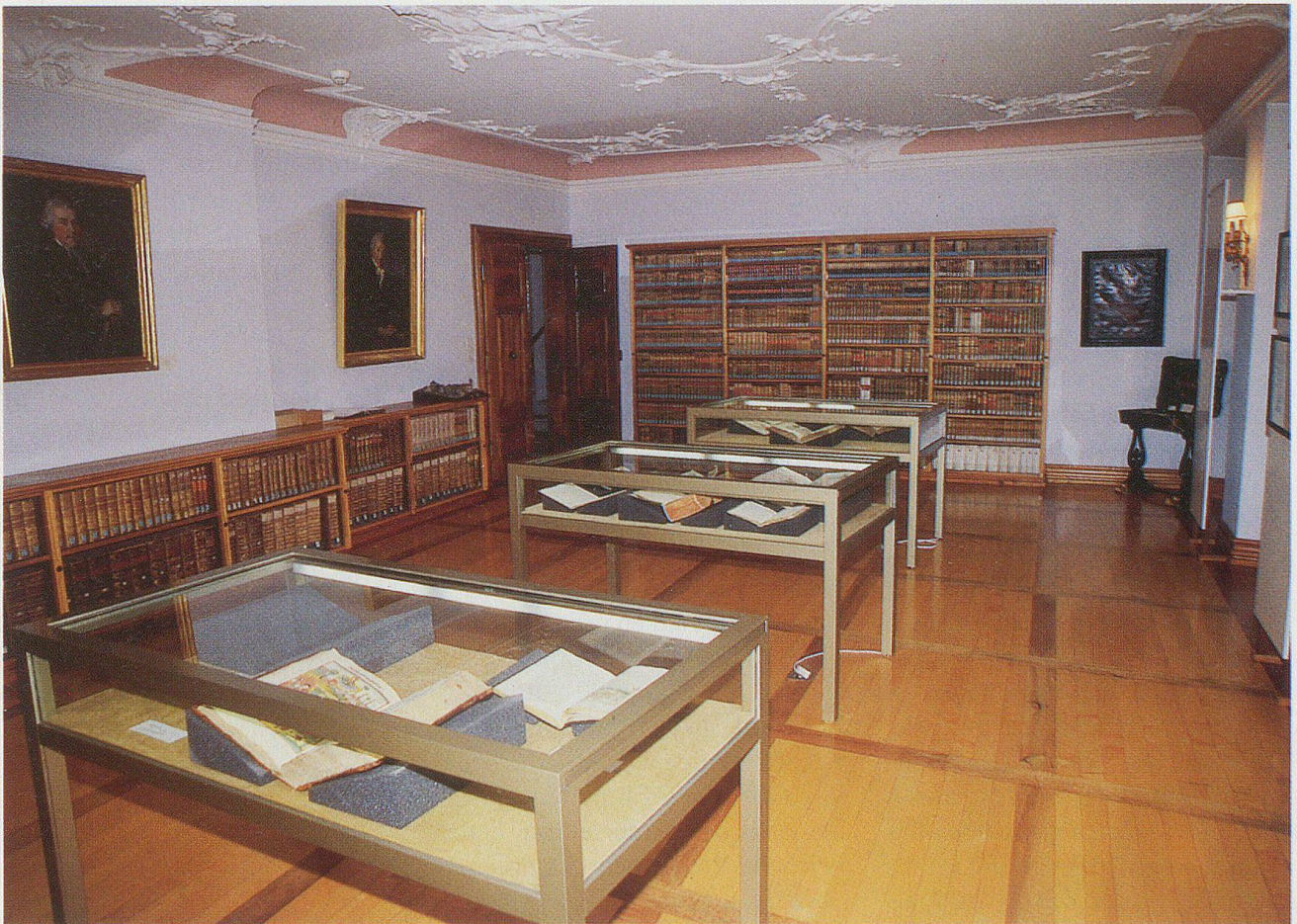
Fest- und Ausstellungssaal der Kantonbibliothek im dritten Obergeschoss des Pfarr- und Gemeindehauses: Prächtig und repräsentativ.

das Staatsarchiv aus Gründen der Rechtssicherheit und zur Dokumentation der politischen Geschichte alles sammelt, was von Regierung und Verwaltung an Schriftstücken und anderen Dokumenten über die Jahrhunderte und Jahrzehnte verfasst wurde, so obliegt der Kantonbibliothek das systematische Sammeln aller Publikationen, die irgendwie mit dem Kanton in Zusammenhang stehen. Daraus ist ein Fundus von mittlerweile über 35 000 Titeln gewachsen. Zu