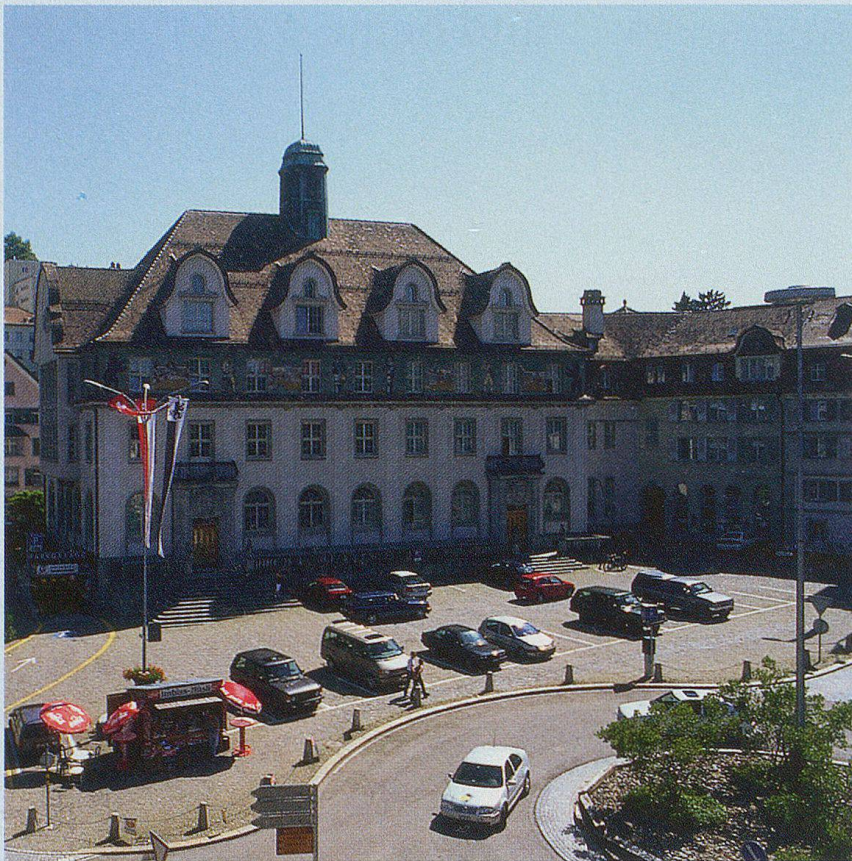
Seit Jahren ist eine Neugestaltung des Obstmarktes ein Thema in Herisau.

appenzellischem Gebiet. Für die Dorfverwaltung und das Dorfgericht wählte die Gemeinde ihre Vertreter, die Ernennung des Ammanns aber stand dem Abt als dem weitaus grössten Grund-