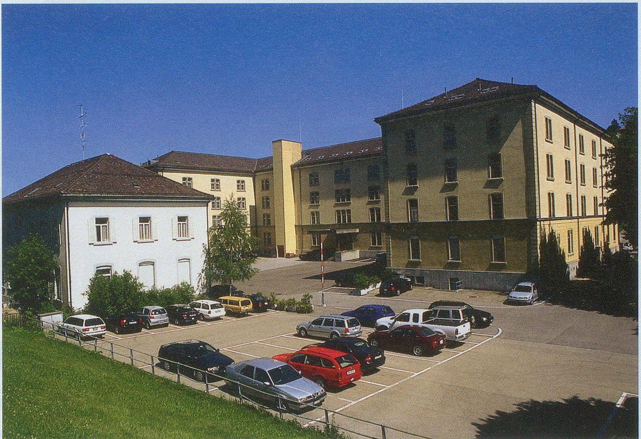
Der Waffenplatz Herisau – wegen der laufenden Armeereform ist die Zukunft ungewiss.