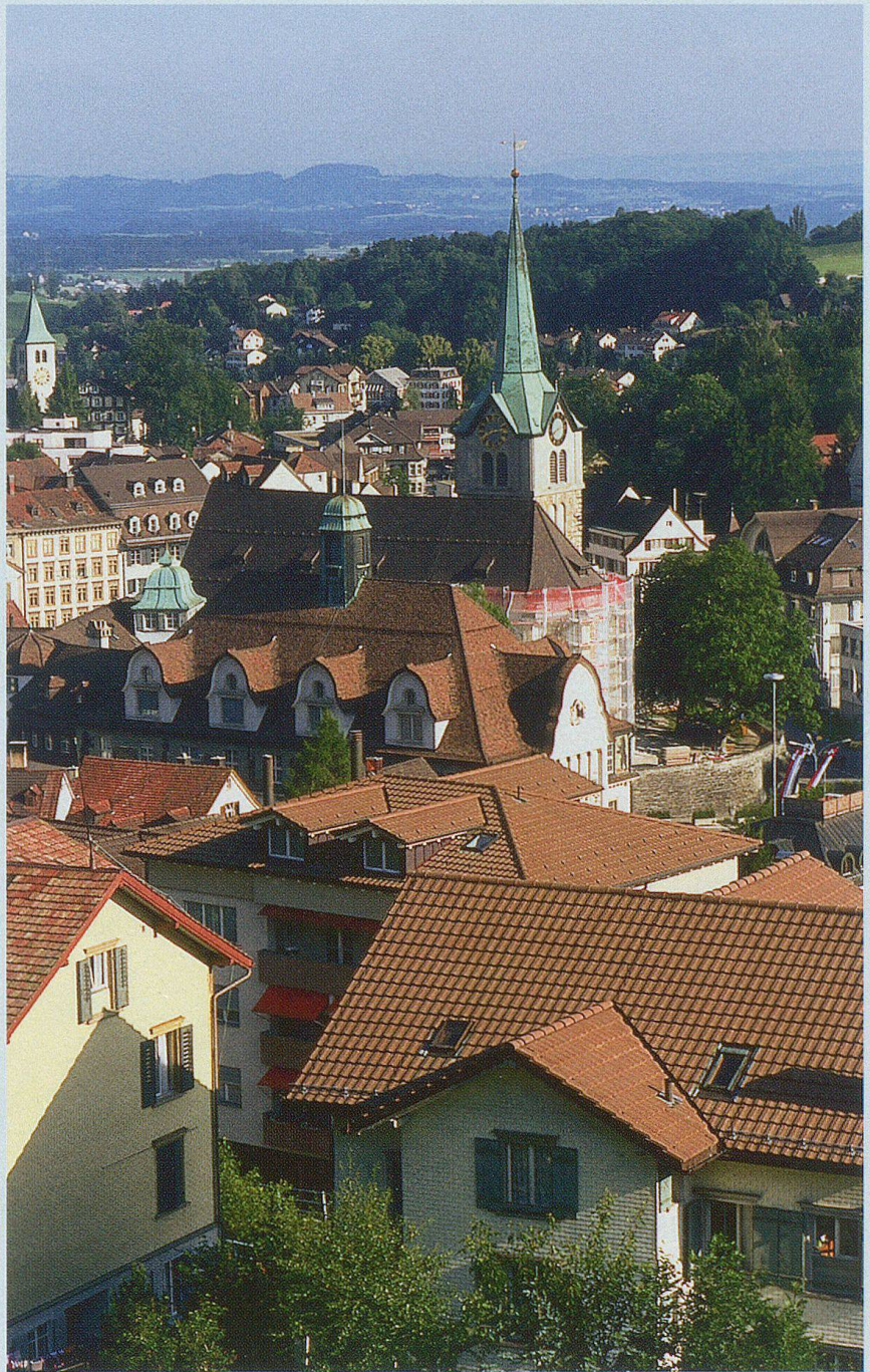
Über den Dächern des Herisauer Dorfzentrums.

Erstmals urkundlich erwähnt wird der Name Herisau im Jahre 837 als Aue des Herin in der Gossauermark gelegen. Dieser Gau bildete einen Teil des Herzogtums Alemannien. Durch Schenkung kam anno 868 ein grösserer Teil unserer Gegend an das Kloster St. Gallen, das diesem Gebiet seine volle Fürsorge zuwandte und einen Klostermeier einsetzte. Im Jahre 907 erhob der damalige Abt und Bischof Salomon die Aue des Herin zu einem eigenen Kirchspiel, d.h. der südliche Teil der March Gossau wurde abgetrennt und Herisau erhielt eine eigene Kirche, die erste auf