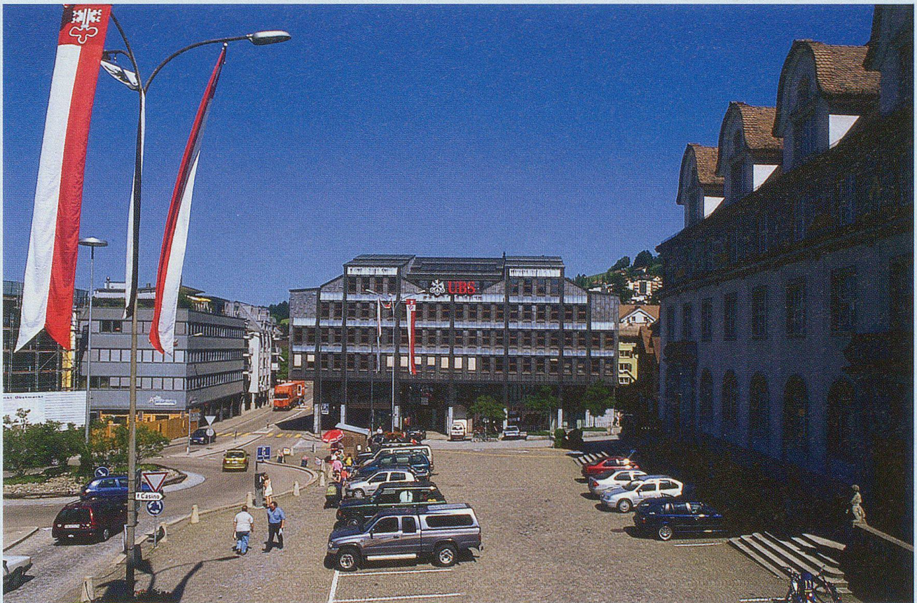
Der Obstmarkt aus anderer Optik, links knapp erkennbar der Neubau «Treffpunkt Obstmarkt».

auch das Meieramt (also das Gebiet der Gemeinde von Herisau) mit den beiden Burgen einsteckten. Innert 50 Jahren wurde aber dieses Pfand wieder ausgelöst, ja das Gotteshaus erlangte sogar die Reichsvogtei über Herisau und die Vogtei Schwänberg. Der schlaue Abt Kuno von Stoffeln (1379–1411) hob damit die letzte schwache Verbindung der Gemeinde mit dem Kaiser und dem Reiche auf. Sein hartes und unkluges Regiment führte schliesslich dazu, dass sich die Gotteshausleute von St. Gallen, Gossau, Waldkirch, Wittenbach, Bernhardzell und Herisau mit Urnäsch, Hundwil, Teufen und Ap-