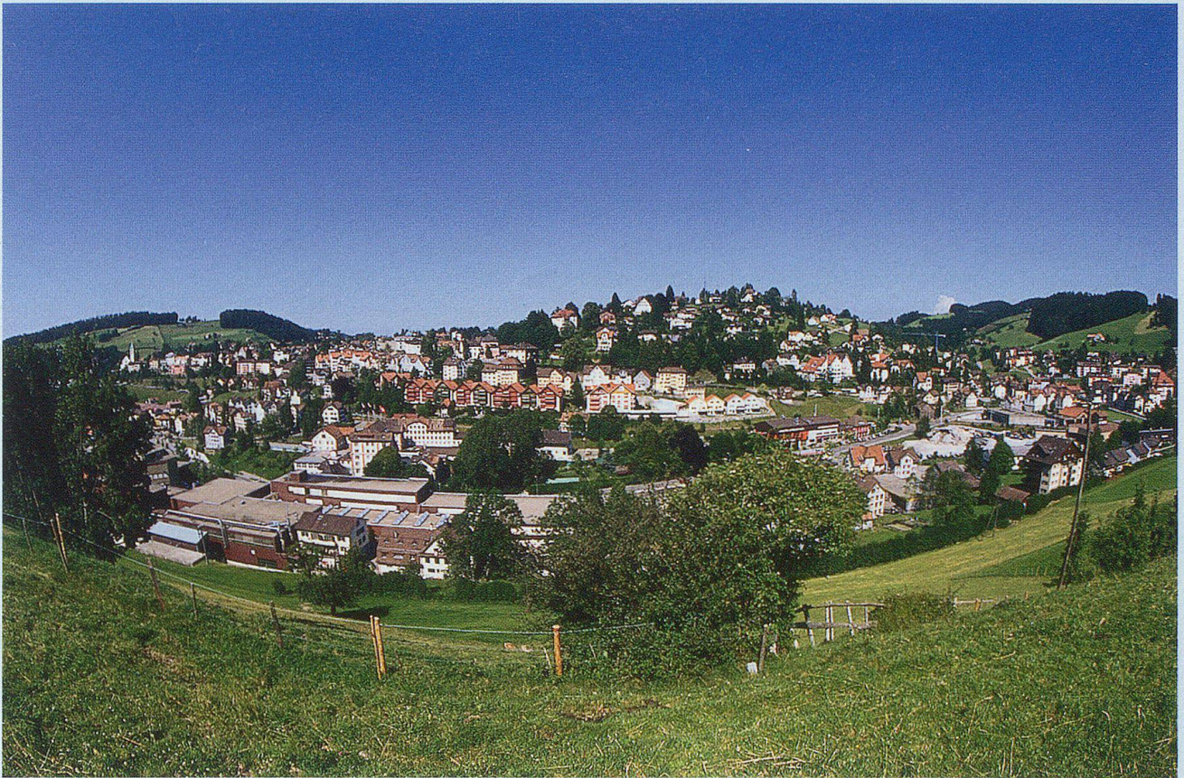
Herisau von Westen.

zum Wohnort gewählt wurde, entschied die Landsgemeinde von 1598 mit kleinem Mehr, dass das Rathaus nach Trogen zu stehen kommen solle. Den übrigen Rhoden wurde freigestellt, ebenfalls ein Rathaus zu bauen, was in Herisau bereits 1601 geschah. Mit der Einführung der berühmten Sitterscheidewand im Jahre 1647 wurde erwirkt, dass die Landesbeamten alle zwei Jahre neu gewählt werden mussten und der grosse Rat abwechselungsweise in Herisau und Trogen tagte. Das 18. Jahrhundert, reich an inneren Zerwürfnissen, brachte dem Kanton und insbe-