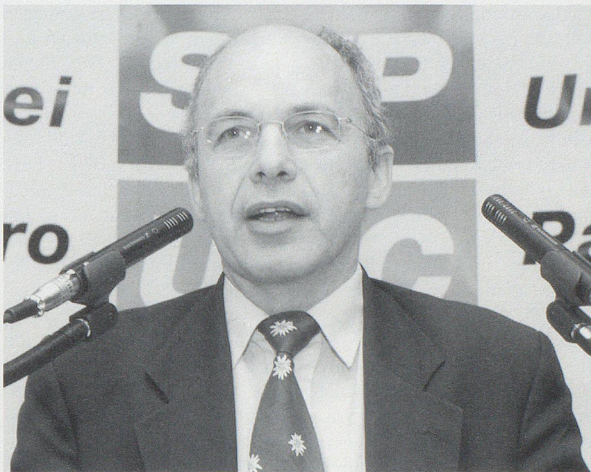
Die SVP – im Bild Parteipräsident Ueli Maurer – war die grosse Siegerin der Nationalratswahlen vom 24. Oktober 1999.

Wie schon vier Jahre zuvor bestimmte die SVP den Nationalrats-Wahlkampf 1999. Besser als alle andern Parteien verstand sie es, aktiv Themen zu besetzen – so sammelte sie insbesondere mit der Asylfrage, der Ausländerkriminalität und dem Ruf nach Steuersenkungen Punkte. Mit 22,5% (1995: 14,9%) avancierte die SVP zur stärksten Kraft im bürgerlichen Lager und zog mit der SP gleich. Während die SP bei den Nationalratssitzen von 54 auf 51 zurückfiel, steigerte die SVP ihre Mandatszahl von 29 auf 44. Glimpflich als erwartet kamen CVP und FDP weg: Mit 43 Sitzen im Nationalrat und 18 im Ständerat blieb die FDP die stärkste