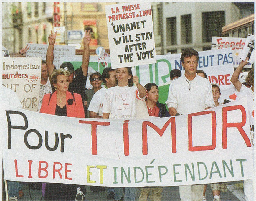
Etwa 150 Personen, zum grossen Teil Portugiesinnen und Portugiesen, haben am Freitag, 17. September 1999, in Genf mit einem Protestmarsch den Rückzug der indonesischen Armee aus Ost-Timor gefordert.

Schwierig gestaltete sich die Situation auch im afrikanischen Kleinstaat Sierra Leone. Vergeblich bemühte sich dort eine aus Afrikanern und Asiaten zusammengesetzte UNO-Friedenstruppe um die Beendigung des seit acht Jahren dauernden Bür-