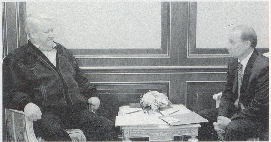
Wechsel im Präsidentenamt: Am 31. Dezember 1999 übergab Boris Jeltsin die Amtsgeschäfte Wladimir Putin. Am 26. März 2000 siegte Putin bei den Präsidentschaftswahlen erwartungsgemäss im ersten Wahlgang.

Treibende Kraft war Wladimir Putin. Präsident Boris Jeltsin hatte den 46-jährigen ehemaligen Geheimdienstmann am 9. August an die Spitze der russischen Regierung gerufen.