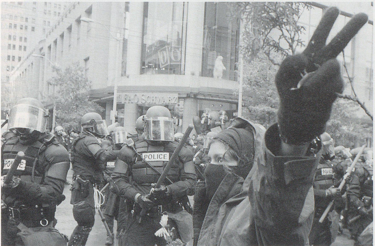
Rund 30 000 Menschen aus aller Welt protestierten in Seattle – anlässlich der WTO-Konferenz – gegen negative Auswirkungen der Globalisierung. Dabei kam es auch zu gewaltsamen Ausschreitungen.

wälzungen, die seit den achtziger Jahren im Gange sind, nicht abschätzen. Dass sie Gesellschaften und Staaten stärker prägen als jede andere Entwicklung seit der industriellen Revolution, ist heute schon offenbar. Nie zuvor hat der Mensch vor allem in den industrialisierten Ländern weniger arbeiten müssen, um seine Existenz zu sichern. Allein im letzten Jahrhundert hat sich die Wochenarbeitszeit um ein gutes Drittel verringert. Auch die Arbeit selbst hat ihren Charakter verändert. Die Versorgung mit landwirtschaftlichen Gütern liegt in den Händen von nur