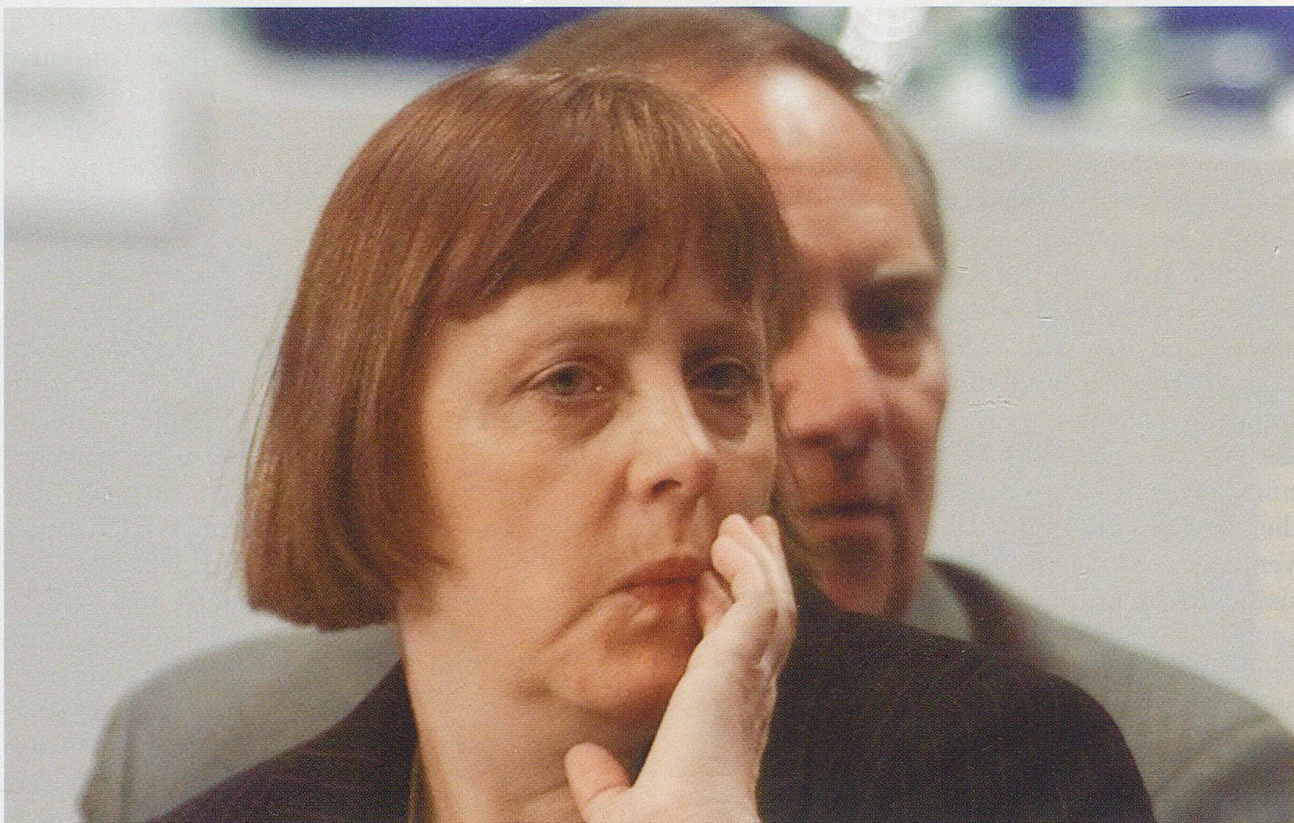
Nach dem Rücktritt des CDU-Vorsitzenden Wolfgang Schäuble als Folge der Parteispendenaffäre in Deutschland wurde Angela Merkel zur neuen CDU-Chefin gewählt.

ten Israel und Syrien an, die seit 1996 unterbrochenen Verhandlungen wieder aufzunehmen. Direkte Gespräche in der amerikanischen Stadt Shepherdstown Anfang Januar scheiterten jedoch an der Unvereinbarkeit der Standpunkte bezüglich der Rückgabe der Golan-Höhen. In einem einseitigen Schritt zog Israel Ende Mai seine Truppen aus Südlibanon zurück. Milizionäre der radikal-islamischen Hisbollah übernahmen umgehend die Kontrolle über den Grenzbereich, den die Israelis seit 22 Jahren zusammen mit der maronitischen SLA-Miliz kontrolliert hatte.