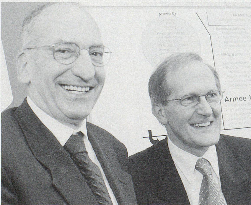
Am 21. Mai 2000 billigte das Schweizervolk mit 67,2 Prozent Ja-Stimmen die bilateralen Abkommen mit der EU. Entsprechend freudig kommentierten die Bundesräte Pascal Couchepin und Joseph Deiss das Ergebnis.

über 40 000 hochgeschellt, und 1999 wurde eine weitere Verdopplung befürchtet: Allein im Juni wurden 9000 neue Asylgesuche gezählt – nie seit dem Zweiten Weltkrieg hatten so viele Flüchtlinge in so kurzer Zeit Einlass begehrt. Angesichts des Zustroms mussten auch Truppenunterkünfte als Aufnahmezentren eingerichtet werden. Zur Betreuung wurden auch Armeedetachements eingesetzt. Die Schweiz war für kosovarische Flüchtlinge besonders attraktiv, weil sich hier bereits an die 200 000 Landsleute als Gastarbeiter aufhielten; ausserdem schoben EU-Länder wie Italien die ungebetenen Gäste in die Schweiz weiter. Nach dem Ende des Krieges entspannte sich die Situation rasch – zumal Bundesrätin Metzler und die Kantone klarmachten, dass sie die vorübergehend aufgenommenen Kriegsflüchtlinge möglichst rasch in ihre Heimat zurückführen wollten. Mehrere zehntausend Kosovaren machten von der Rückkehrhilfe des Bundes Gebrauch; lediglich rund 10 000 erklärten sich bis zum Stichtag des 31. Mai 2000 nicht zur freiwilligen Heimkehr bereit.