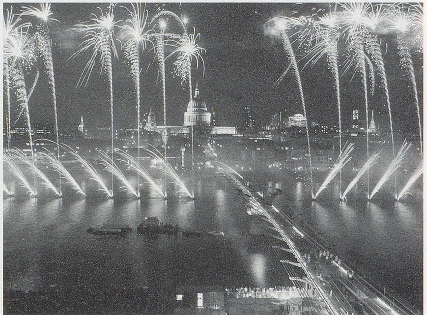
Weltweit wurde das «Millennium» mit einem Riesenaufwand gefeiert.

Als sich 1903 die ersten Menschen, die Brüder Orville und