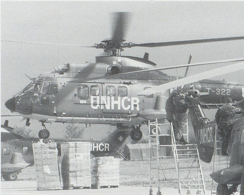
Während des Kosovo-Konflikts entsandte die Schweiz ein Detachement mit Superpuma-Helikoptern, um in Albanien Transporte zugunsten der Flüchtlinge auszuführen.