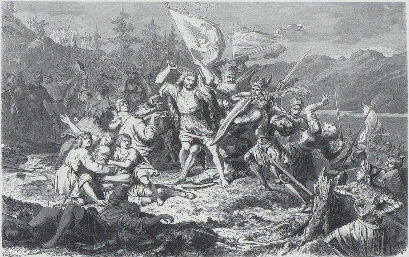
Die Schlacht am Stoss, den 17. Juni 1405.

hobener Waffe die Bergkrieger auf die Eindringlinge hinunter. Die kriegspsychologische Wirkung war abermals perfekt. Die Österreicher gerieten in Verwirrung, und als sie sich zurückziehen wollten, versperre ihnen die Letzi den Weg. Hier am engen Ausgang schnappte die Falle endgültig zu: Erbarmungslos metzelten die Appenzeller die Feinde nieder. Wer vorerst Glück hatte und durch die Breische gelangte, wurde bis nach Altstätten hinunter verfolgt und niedergemacht. Rund 400 Feinde wurden erschlagen. Die Niederlage der Österreicher war derart, dass der Herzog sich eilig zurückzog.