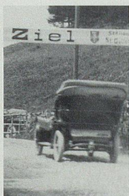
«Automobil- Wettrennen Alt- stätten–Ruppen»