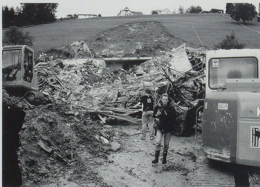
Was in Lutzenberg nach einem verheerenden Unwetter von diesem Haus noch übrig blieb; drei Bewohner fanden den Tod.