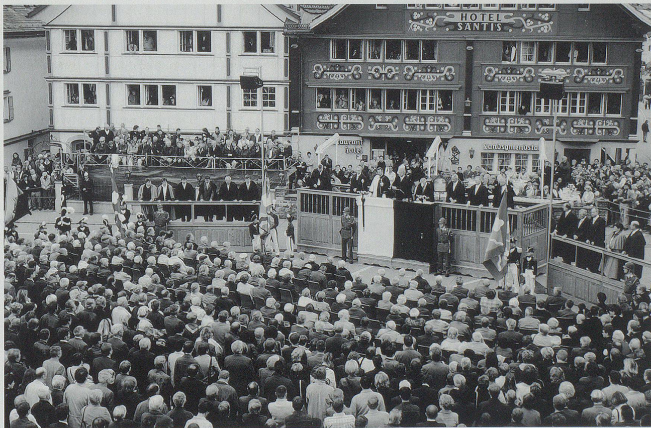
Die Innerrhoder Landsgemeinde 2003.