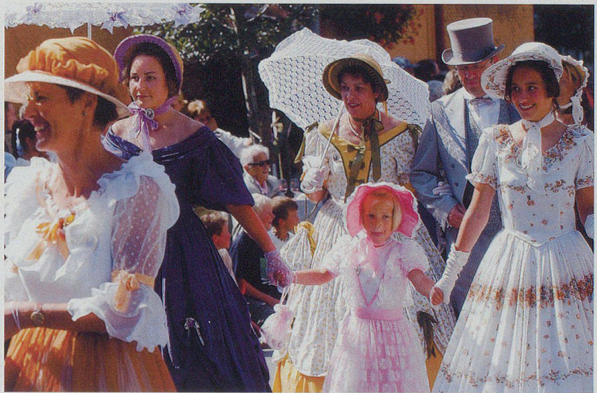
Optimale Bedingungen für das Jubiläums-Biedermeierfest.

Auszeichnung für Wolfhalden: Die Ansiedlung des Autorennfahrers Michael Schumacher in Wolfhalden ist zwar gescheitert, doch ganz leer ging die Gemeinde trotzdem nicht aus: Wolfhalden wurde mit einem Preis für