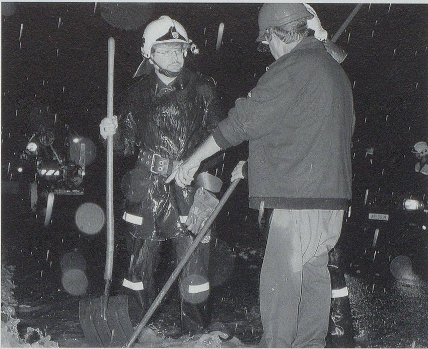
Rettungskräfte standen rund um die Uhr im Einsatz.

tembersetzung an das Parlament und zog eine Bilanz. Der Regierungsrat habe mit Trauer und Bestürzung zur Kenntnis genommen, dass das Unwetter in Lutzenberg drei Tote gefordert hat, dass rund 50 Personen vorübergehend evakuiert werden mussten, dass viele Mitbürgerinnen und Mitbürger enorme materielle und auch psychische Schäden erlitten haben. An über 400 Stellen gerieten Hänge ins Rutschen; an 100 Stellen wurden Verkehrswege verschüttet und im ganzen Kanton über 2000 Schadenfälle gemeldet. Neben den Kosten für das Strassennetz – die Instandstellung kostete fast 10 Millionen Franken – muss Ausserrhoden in den kommenden Jahren auch 27 bis 37 Mio. Franken in die Sanierung von