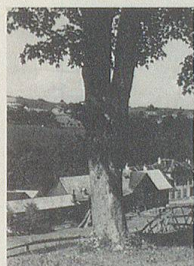
Haus «Linden- bühl», Trogen