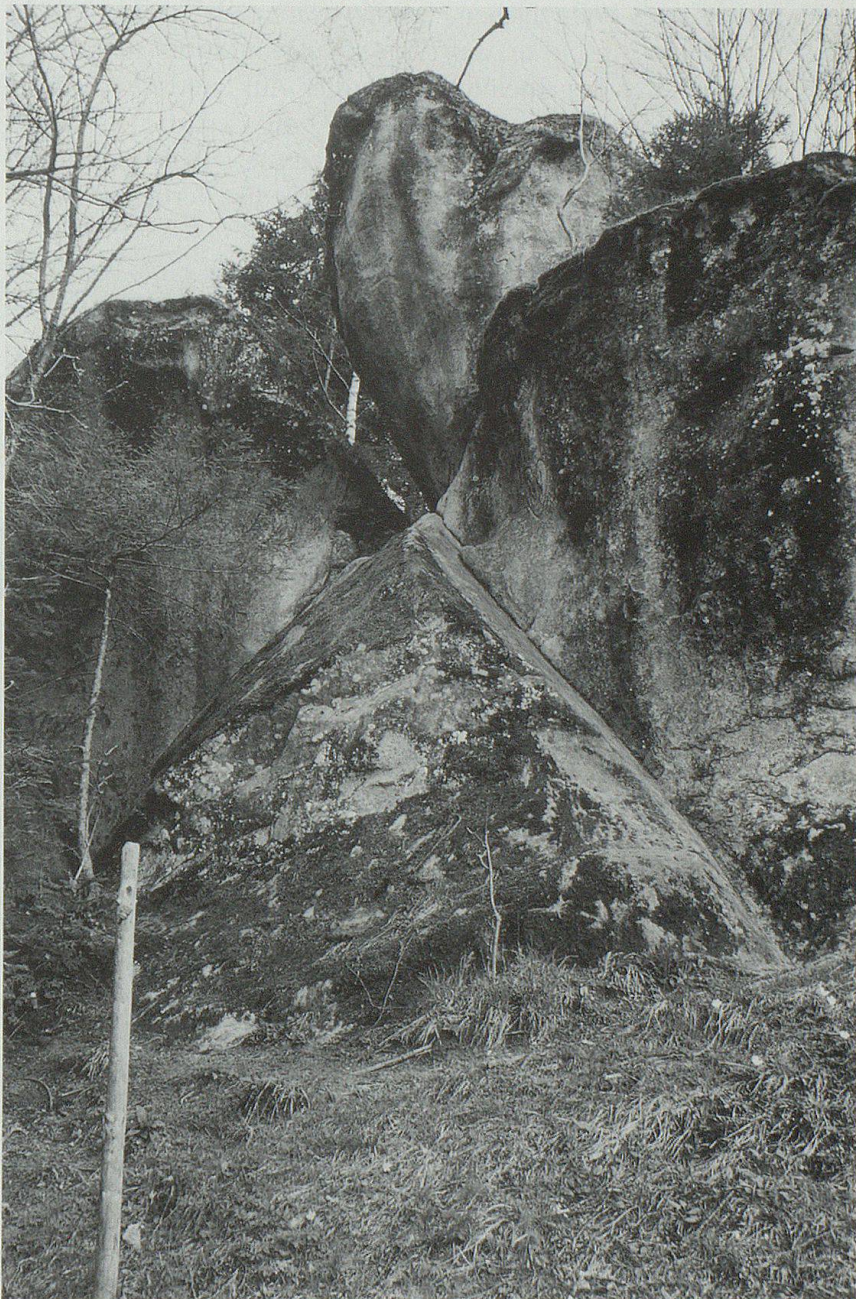
Im Weiler Rasplen (Gemeinde Heiden) erhebt sich am Waldrand der markante Felskopf Kindlistein.