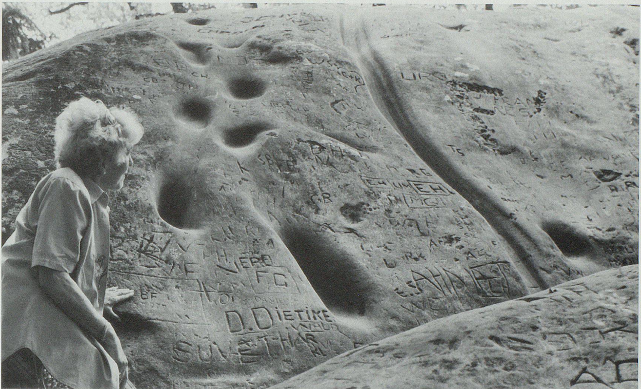
Die schalenähnlichen Einbuchtungen führten zum Begriff «Schalenstein». Rechts eine der wahrscheinlich im Zuge vieler Rutschpartien entstandenen Längsrillen.

Hier soll bei Unfruchtbarkeit in die Tiefe gerutscht worden sein. Erfolge hätten vor allem jene Frauen verzeichnet, die mit nacktem Hintern den Fels hinunterrutschten. Schmerzfrei kann dieser angeblich auch am Kindlistein ausgeübte Kult nicht gewesen sein. Rutschende Frauen hätten zwischen den Beinen zum Bremsen einen Stock oder Stecken gehalten, der die Rinnen im Verlaufe vieler Jahre ausgeschliffen haben soll. Gemäss anderen Quellen sei auch paarweise gerutscht worden. Yves Schumacher in seinem Buch «Steinkultbuch Schweiz»: «Ritualisierte Rutschpartien von Brautleuten waren bei den Alemannen