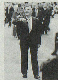
Bundesrat Hans- Rudolf Merz