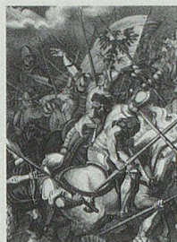
Die Appenzeller Freiheitskriege