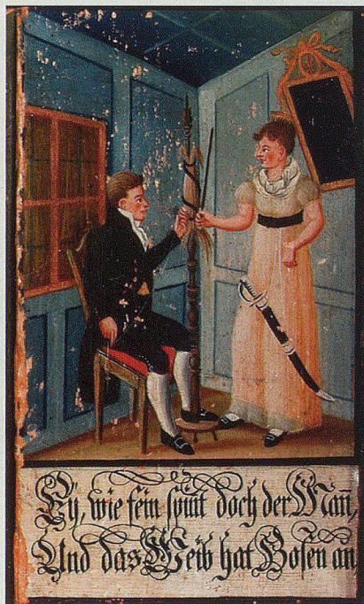
Detailansicht der Männerfigur rechts in der unteren Türfüllung.