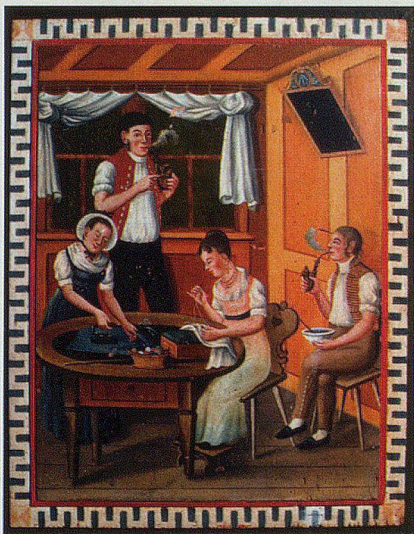
Stubenszene in der unteren Türfüllung.