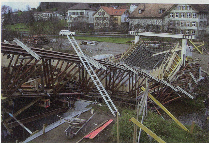
Glück hatten am 5. Dezember in Bühler jene Arbeiter, als sie auf dem Brückengerüst über den Rotbach standen, als das Bauwerk plötzlich einstürzte.