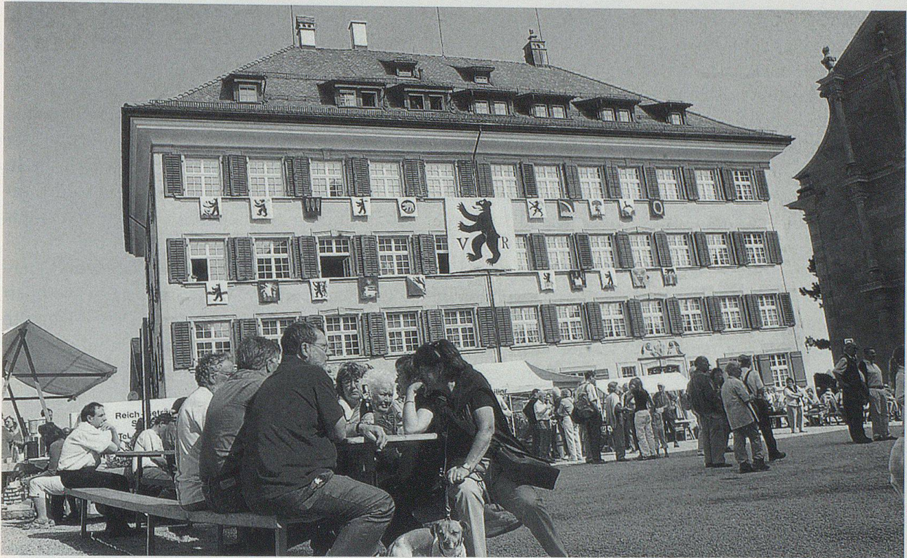
Vor zehn Jahren fiel der Entscheidung zur Abschaffung der Ausserrhoder Landsgemeinde. Ihrer wurde am letzten Aprilsonntag 2007 in Trogen gedacht.

Ja zu einer Urnenabstimmung über die Zukunft dieser Institution. Im darauffolgenden Herbst votierten 9911 Stimmberechtigte für Beibehalten und 11623 für Abschaffung der Landsgemeinde – womit diejenige am letzten Aprilsonntag 1997 definitiv zur letzten Ausserrhoder Landsgemeinde geworden war. Es war – so die Meinung nicht nur damals – die Quittung des Volkes für den Niedergang der Ausserrhoder Kantonalbank, die ein Jahr zuvor an die Schweizerische Bankgesellschaft (später UBS) verkauft worden war. Dann gab es seit der Einführung des Frauenstimmrechts auch Gegner der Landsgemeinde. Diese beiden