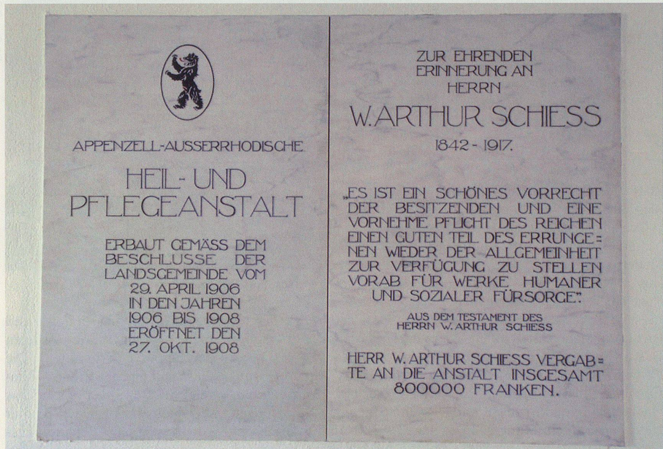
Inschrift W. Arthur Schiess.

Offenheit als Konzept – das war zukunftsweisend und hat sich bewährt. Trotz Verzicht auf Mauern und Zäune, auf alles «Irrenanstalts- und Kasernenmässige», gab es «nicht mehr Entweichungen» als in den da-