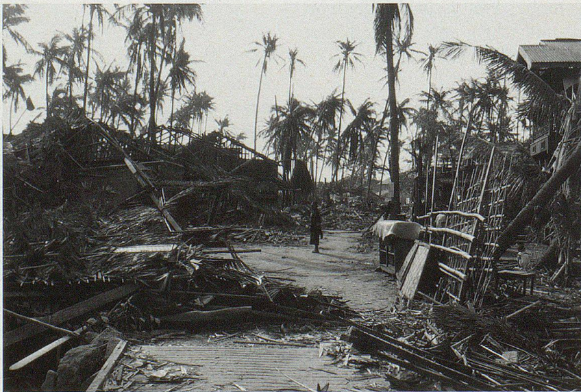
Der Tropensturm «Nargis» verwüstet in der Nacht vom 2. auf den 3. Mai zahlreiche Dörfer und Städte im Süden Myanmars sowie die Hafenstadt Rangoon. Weit über 100 000 Menschen finden bei dieser Katastrophe den Tod.

Obschon sich das Ausmass der Katastrophe rasch abzuzeichnen begann – Schätzungen zufolge befanden sich gegen zwei Millionen Menschen in akuter Not –, liess das Regime Unterstützung aus dem Ausland nur zögerlich zu. Mitarbeitern zahlreicher Hilfsorganisationen wurden Visa verweigert, Hunderte von Helfern sassen in Bangkok wegen bürokratischer Hürden fest. Hilfslieferungen wurden vom Militär beschlagnahmt. Dem Ausland wurde beschieden, die betroffenen Menschen bräuchten keine Schokoladeriegel, sie könnten sich auch von Fröschen und Schnecken ernähren. Dass