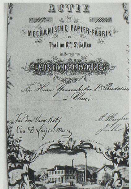
Von Generalvikar P. Theodosius, Chur, persönlich gezeichnete Aktie der von ihm gegründeten Papierfabrik in Thal SG, im Wert von 1000 Franken.

1862 wollte er seine Vorstellungen mit der Gründung einer Papierfabrik in Thal SG verwirklichen, wobei er selbst ebenfalls Aktien zeichnete. Auch dieser Versuch scheiterte, doch vermochte sich der Betrieb später