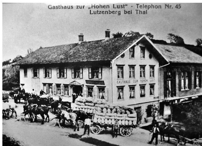
Hochbetrieb auf der neuen Mittellandstrasse beim Gasthaus Hohe Lust in Lutzenberg, dem Treffpunkt der Fuhrleute am Weg von Rheineck nach Heiden.

ten ist bereits 1212 bezeugt. Damals wurde Kaiser Friedrich II. samt Gefolge vom Abt von St. Gallen auf einer Reise von Altstätten ins Kloster St. Gallen geleitet. Angesichts des immer wieder von Überschwemmungen heimgesuchten Rheintals galt der Weg über den Berg nach St. Gallen als zwar beschwerliche, aber zugleich sichere und direkte Route. Anfang der 1830er-Jahre projektierte der Südtiroler Ingenieur Alois Negrelli (1799–1858), Erbauer des Suezkanals und der Bahnlinie Zürich–Baden, den Ausbau der Strasse von St. Gallen bis zum Ruppen. Die Fortsetzung vom Ruppen bis Altstätten planten die Ingenieure Naeff, Altstätten, und Loretz, Zürich. 1838 konnte die Strasse befahren werden, die ab 1842 auch von bis Feldkirch führenden Eilkutschen der Post benützt wurde. An der Finanzierung des Prestigewerks beteiligte sich der