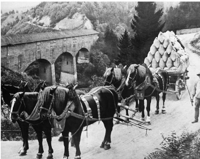
Müllereifuhrwerk im Hundwilertobel, wo die Urnäsch bis 1925 von einer stattlichen Holzbrücke überquert wurde.

Der Weg von St. Gallen via Speicher und Trogen zum Ruppen und hinunter nach Altstät-