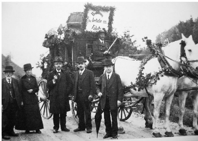
Die neue Mittellandstrasse erleichterte auch den Postkutschenverkehr. Hier die letzte Kutsche in Wald im Jahre 1920. Seither verkehren auf der Strecke Heiden-Trogen Postautos.