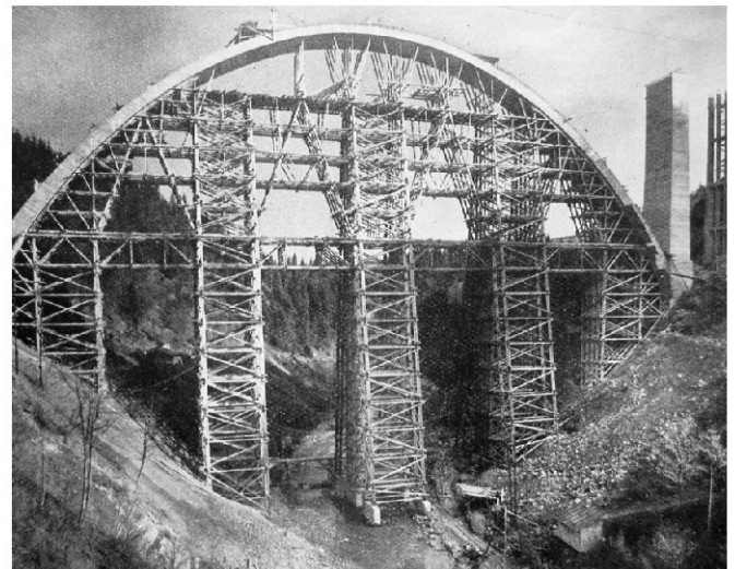
Bau der neuen Hundwilertobelbrücke in den Jahren 1924/25. Diese Brücke wurde 1993 gesprengt, nachdem 1992 die heutige Brücke fertiggestellt war.