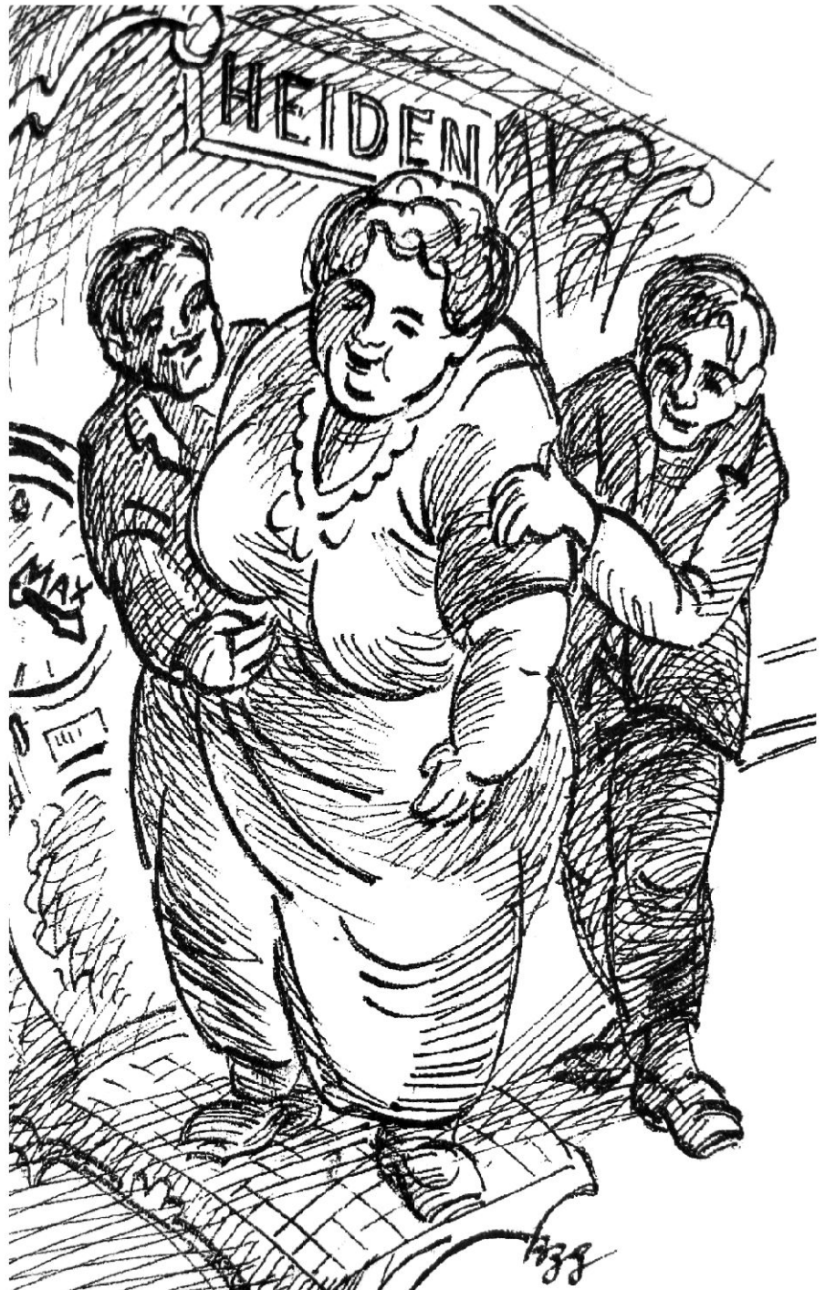
Illustration: Ernst Bänziger

Paula alias Berta war wenig über 150 Zentimeter gross und 468 Pfund schwer. Landauf und landab sorgte jetzt auf Jahrmärkten jener Budenwagen für Furore, auf dem weithin sichtbar das