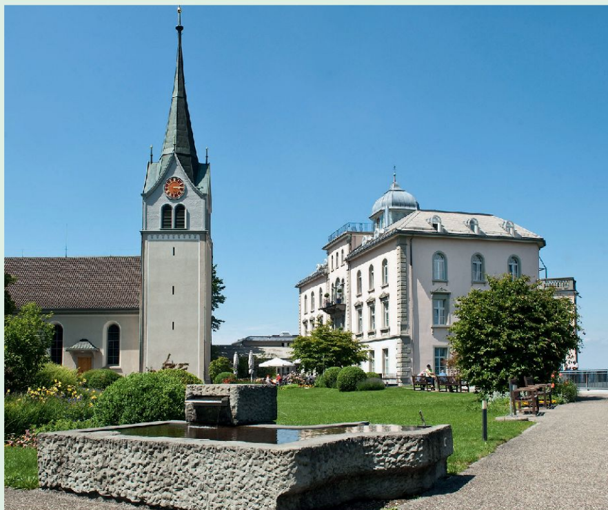
Kirche Walzenhausen und Rheinburg-Klinik.

Alles Wissenswertes über die drei Gemeinden ist auf ihren attraktiv und jederzeit aktuellen