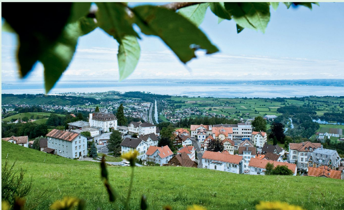
Blick auf Walzenhausen und den Bodensee; im Hintergrund deutsches Ufergebiet.