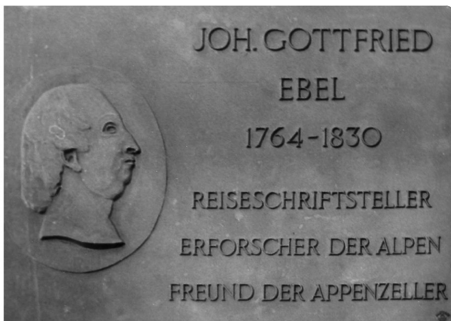
Beim Wildkirchli unterhalb der heute ab Wasserauen per Luftseilbahn bequem erreichbaren Ebenalp erinnert eine Gedenktafel an Johann Gottfried Ebel.

1802 erschien ein weiteres Werk Ebels. Darin hält er unter anderem seine Eindrücke der Regionen Rheintal, Toggenburg und Werdenberg fest. Fast schwärmerisch wird das Rheintal beschrieben: «Die Wanderung vom Bodensee durch Rheineck, Margarethe, Balgach, Marbach, Altstätten bis Haard ist einer der angenehmsten Spaziergänge, welche ich je gemacht habe. Das Tal gleicht einem herrlichen Garten. Wiesen, Felder, Weinberge und Obstbäume ohne Zahl überziehen die wo-