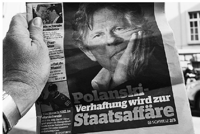
Die Verhaftung Roman Polanskis bei der Einreise in die Schweiz Ende September 2009 führte weltweit zu Reaktionen.