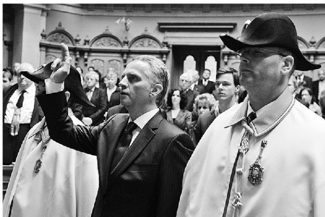
Am 27. September wurde der Neuenburger Freisinnige Didier Burkhalter als Nachfolger von Pascal Couchepin in den Bundesrat gewählt.