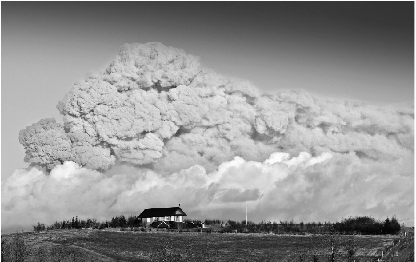
Der Ausbruch des Vulkans Eyjafjallajökull in Island brachte während Tagen den gesamten Luftverkehr in Nord- und Zentraleuropa zum Erliegen.

Für eine weltweite Premiere sorgte Island. Der Ausbruch des Vulkans Eyjafjallajökull führte im April 2010 während Tagen zum Erliegen des gesamten Luftverkehrs in Nord- und Zentraleuropa. Island gilt als eine der vulkanisch aktivsten Zonen der Erde. Der Eyjafjallajökull ist insofern ein besonderer Vulkan, als er sich unter einem Gletscher befindet. In den Jahren 1821 bis 1823 war er zum letzten Mal ausgebrochen. Am 20. März 2010 kam es erstmals wieder zu Eruptionen. Der Eyjafjallajökull produzierte nicht nur einen gigantischen Lavastrom, sondern auch viel Asche. Diese verband