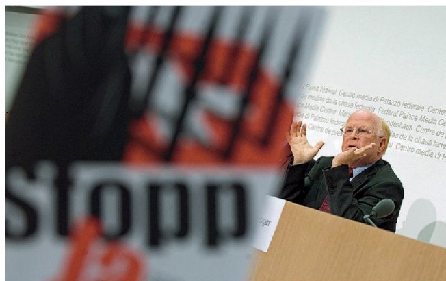
Am 29. November 2009 stimmte das Schweizervolk der Minarettverbots-Initiative mit einem Ja-Anteil von 53,4 % zu. Im Bild SVP-Nationalrat Ulrich Schlueter.