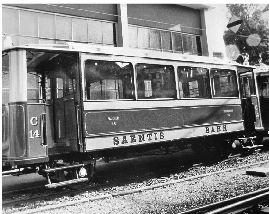
1912 wurde die von Appenzell bis Wasserauen führende Säntisbahn eröffnet. Geplant war eine Weiterführung auf den Säntis, und noch lange nach der Eröffnung der Säntis-Luftseilbahn (1935) trugen die Waggons stolz die Aufschrift «Saentis-Bahn».