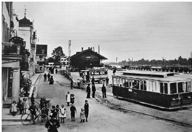
Tram der RhW beim Bahnhof Rheineck. Im Hintergrund der Wagen des bereits 1906 eröffneten Automobilkurses Rheineck–Lutzenberg–Wolfhalden–Heiden.

Die ausschliesslich mit dem Gewicht von Wasser in Bewegung gesetzte Standseilbahn Rheineck–Walzenhausen (RhW) hatte die Talstation gezwungenermassen am Fusse des Berges zu erstellen. Dadurch waren die Passagiere gezwungen, den fast einen Kilometer langen Weg zum Bahnhof Rheineck zu Fuss oder mittels aufgebotenen Fuhrwerk zurückzulegen. Der als unhaltbar empfundene Zustände führte 1909 zum Bau einer die RhW-Talstation mit dem heutigen SBB-Bahnhof verbindenden Trambahn. Am 2. Oktober 1909 wurde ein mit Benzin betriebener Tramwagen seiner Bestimmung übergeben. Um bei Pannen gewappnet zu sein, setzte die RhW Anfang 1910 einen zweiten, mit Strom betriebenen Tramwagen ein. Allerdings kam es immer wieder vor, dass beide Trams ihren Dienst versagten. Der Umbau der RhW im Jahre 1958 führte zu einer direkten Linie Walzenhausen bis Rhein-