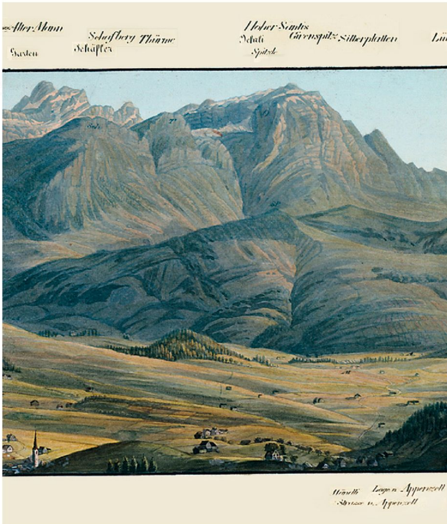
Ausschnitt aus «Panorama vom Gäbris», Aquatinta von Johann Baptist Isenring, nach Zeichnung von Johann Ulrich Fitzi, 1835.

heile Gegenwelt zum industrialisierten und mechanisierten Stadtleben wahrgenommen. In der Natur wurde nach der Einfachheit, dem schöpferischen Ursprung und der Schönheit gesucht. Diese romantische Sicht der Berge finden wir auch in Frölichs Beschreibung: «Die Pflanzenkunde war mir aufs neue lieb, wozu die genussreichen Exkursionen in die nahen Appenzellerberge beitrugen.