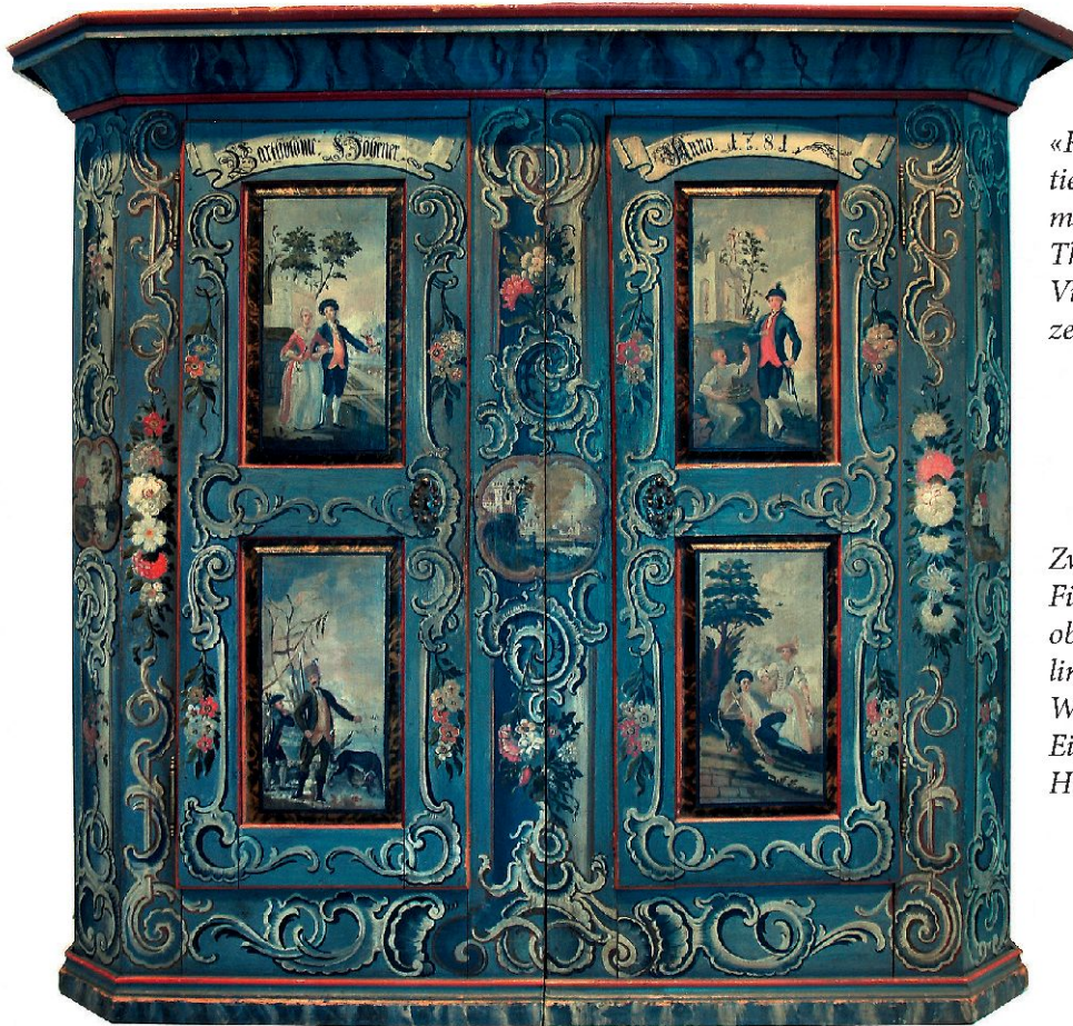
«Repräsentierkasten» mit dem Thema «Die Vier Jahreszeiten».