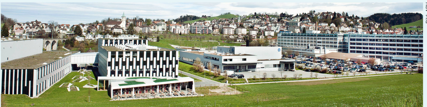
Das neue Industriegelände Hölzli mit Neubauten Metrohm, AG (links) und Huber + Suhner.

Wichtigste Quellen und Literatur Angaben aus dem Buch «Herisau.ch» von Toni Küng und René Bieri sowie von der Gemeinde Herisau