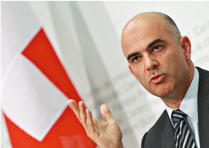
Alain Berset wurde als Nachfolger von Micheline Calmy-Rey neu in die Landesregierung gewählt.