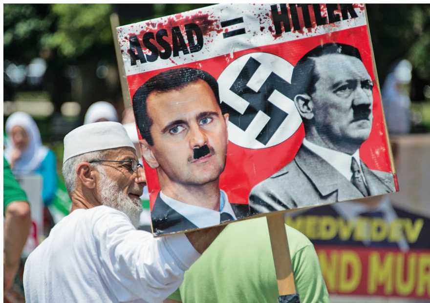
Der Aufstand der Syrer gegen das Assad-Regime forderte Tausende von Menschenleben.

Vergleichsweise unblutig und rasch wurden 2011 autoritäre Regime in Tunesien und Ägypten gestürzt. In beiden Ländern waren jedoch die treibenden Kräfte der Revolutionen nur bedingt deren Profiteure: Sowohl in Tunesien als auch in Ägypten schwangen bei Wahlen islamisti-