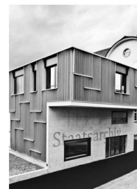
Neues Staats- archiv Appenzell Auserrhoden.