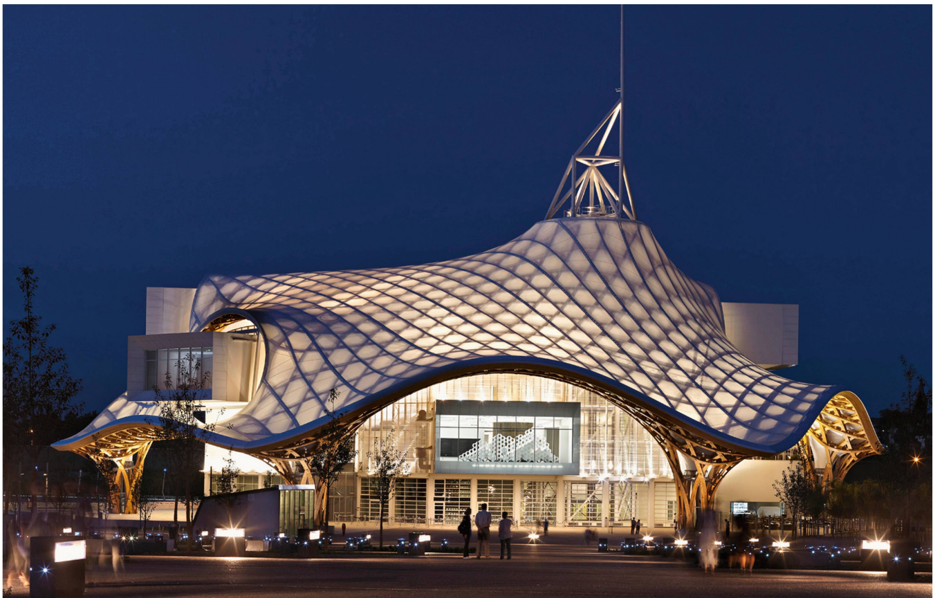
Bild: © Didier Boy de La Tour, by Shigeru Ban Architects Europe, Paris

«Das Glück des Tüchtigen» lächelte den Planern aus Waldstatt und Herisau auch in der Schweiz: Mit dem Neubau Werd des Zürcher Medienkonzerns Tamedia sollten sie gar ein neues Kapitel in der Holzbau-Geschichte schreiben. Zum ersten Mal wurde ein Gebäude in dieser Grösse ohne Stahlverbinder und ohne Nägel und Schrauben errichtet. Die Steckkonstruktion war eine gestalterische Vorgabe des Architekten – wiederum Shigeru Ban. Hermann Blumer und die Ingenieure und Statik-