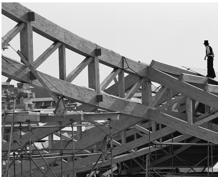
Die BSB-Verbindung kam erstmals beim Bau des Säntisparks in Abtwil zum Tragen.