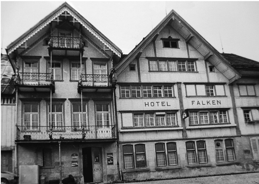
Gemäss der von Pfarrer Sutermeister anonym verfassten Broschüre soll der Dorfkaiser im damaligen Hotel «Falken» (1985 abgebrochen) im Brand, Lachen-Walzenhausen, residiert haben.

Verlag «Gute Schriften» erschien. Obwohl anonym geblieben, eruierte die Einwohnerschaft rasch ihren Pfarrer als Urheber. Bald war auch klar, dass mit «Hubelwies» Walzenhausen und mit «Hinterforst» der Ortsteil Lachen gemeint waren. Und dass die halbe Schweiz mit den Fingern spöttisch auf das dem verwerflichen Lotteriespiel verfallene Walzenhausen zeigte, wurde als grosse Schmach empfunden.