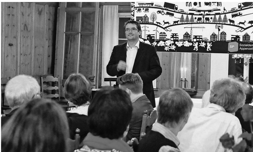
Christian Levrat, Präsident der SP Schweiz, war Ehrengast am Jubiläum der SP Appenzell Ausserrhoden.