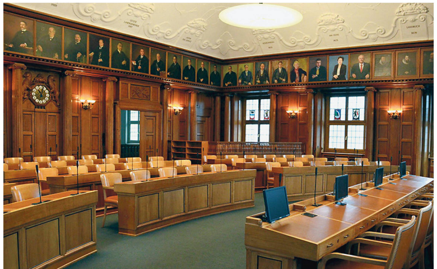
Kantonsratssaal im Regierungsgebäude.

rungsgebäude waren sicherlich die Feiern anlässlich der Wahl von Hans-Rudolf Merz zum Bundesrat 2003 und zum Bundespräsidenten 2008.