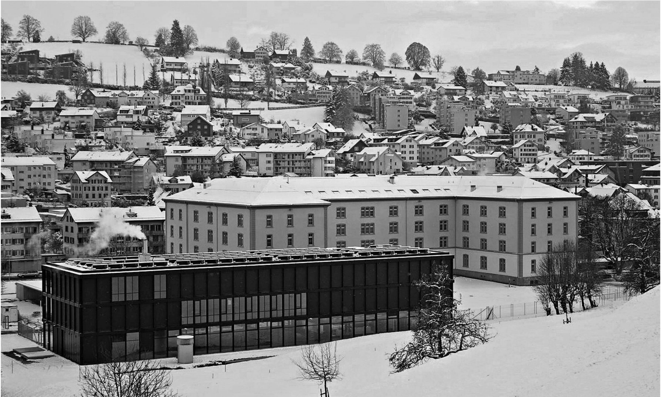
Die Kaserne Herisau erhielt ein neues Theorie- und Verpflegungsgebäude, das denkmalgeschützte Hauptgebäude im Hintergrund wurde umfassend saniert.

Strauss erzielte 121 Stimmen weniger. Sein Wohnsitz ausserhalb der Gemeinde wurde ihm zum Verhängnis.