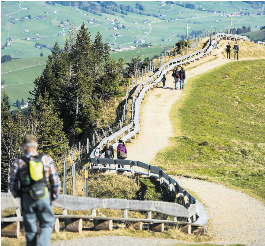
Die längste Bank der Welt auf dem Kronberg.