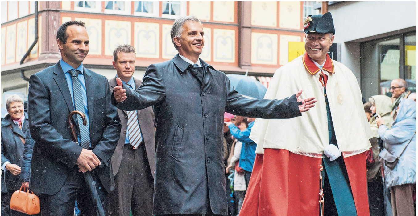
Bundesrat Didier Burkhalter führte die Liste der Ehrengäste der Innerrhoder Landsgemeinde an.

Von den Sachgeschäften gab nur der Kredit von 1,5 Millionen Franken für die Erstellung eines Gehwegs im Bezirk Schlatt-Haslen Anlass zu Diskussionen. Ein einziger Bürger kritisierte den unnötigen Verbrauch von Kulturland und forderte den Bau eines konventionellen Trottoirs. Die Landsgemeinde folgte jedoch der Argumentation der Standeskommission (Regierung) und genehmigte den Kredit mit grosser Mehrheit.