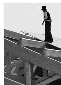
Hermann Blumer erfand das BSB-Verbindungssystem.