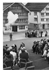
Das Festspiel «Der dreizehnte Ort» in Hundwil.