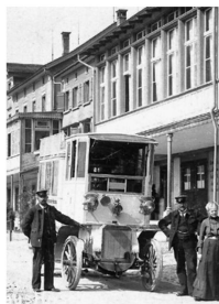
Fahrzeug Nr. 1 in Waldstatt.