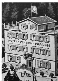
Hotel «Paradies» in Heiden.