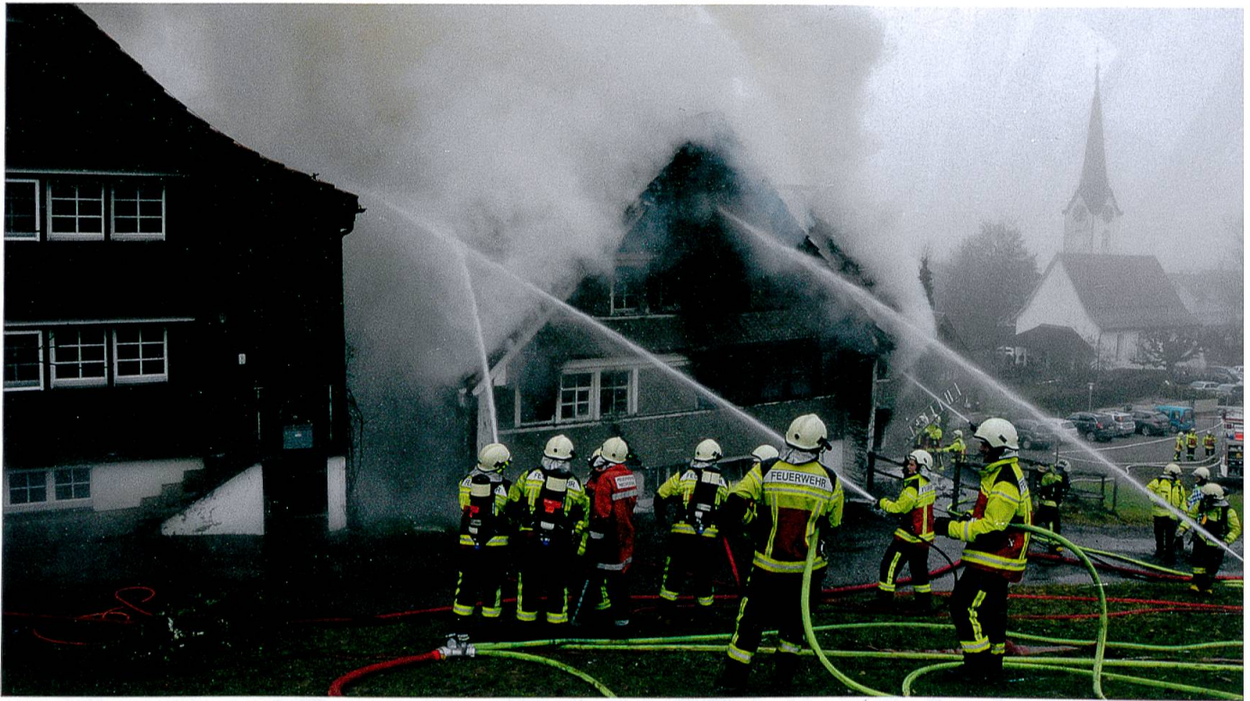
Schönengrund: 5. Dezember 2014.

Ausserrhoden, den Bezirken von Innerrhoden und den angrenzenden St. Galler Gemeinden ein interkantonales Rettungsgerätekonzept verabschieden. Anschliessend erfolgte die gemeinsame Beschaffung von je drei Autodrehleitern und Hubrettern, die geografisch so stationiert wurden, dass alle bebauten Gebiete in beiden Halbkantonen und den angrenzenden St. Galler Gemeinden mit einem Rettungsgerät innert 15 Minuten erreichbar sind.