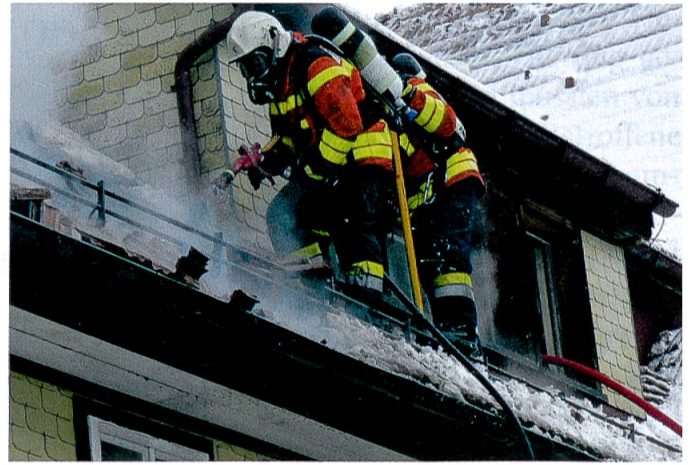
Teufen: 12. Dezember 2010.

spezialisiertes Meinungsforschungsinstitut.