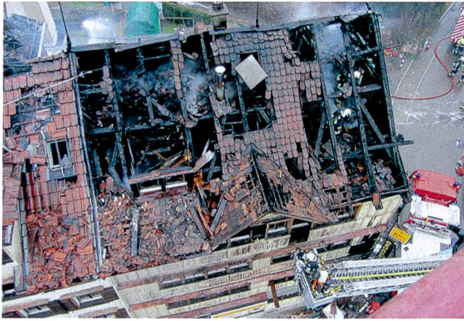
Herisau: George's Bar, 17. Dezember 2014.