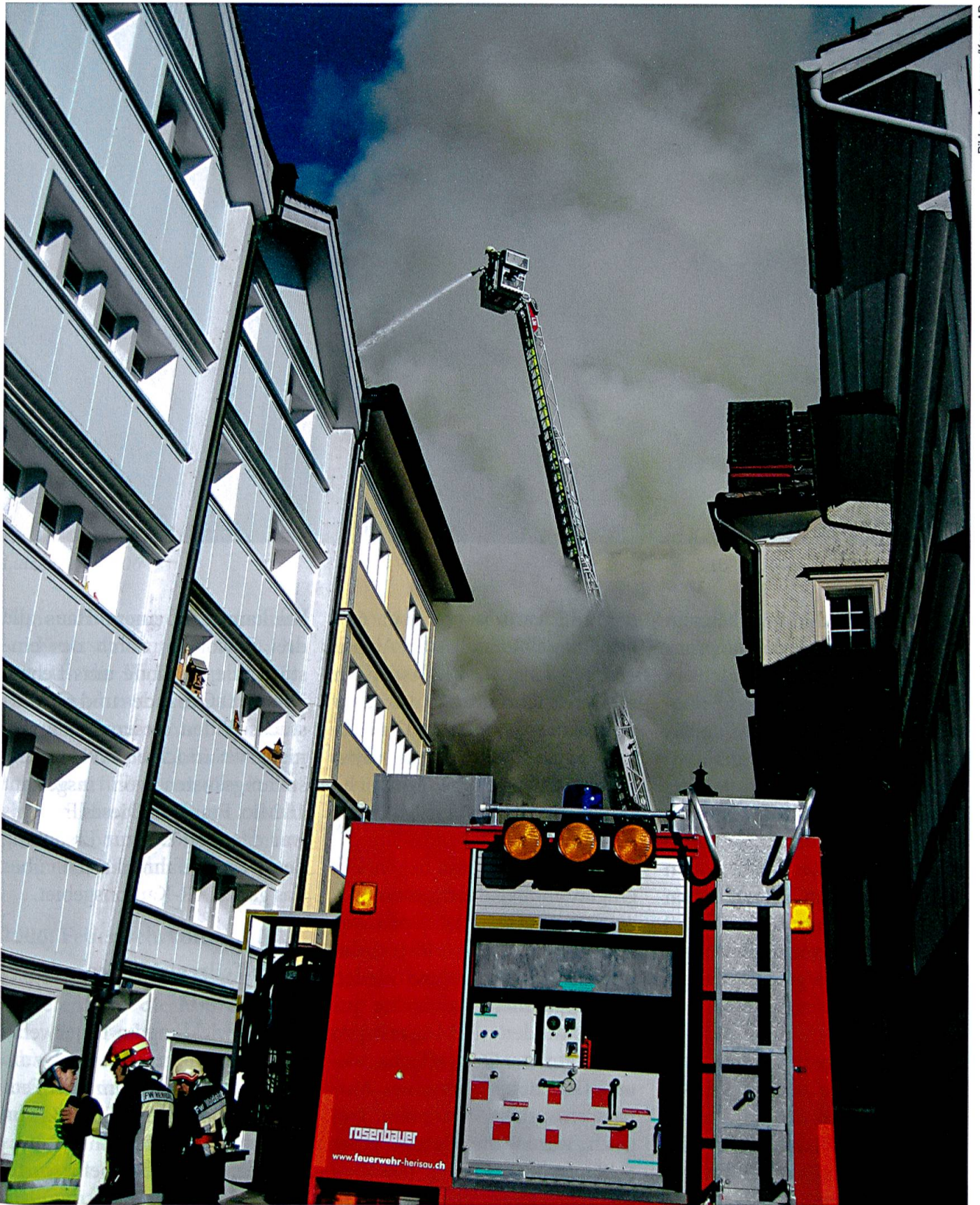
Herisau: Gossauerstrasse, 29. September 2009.