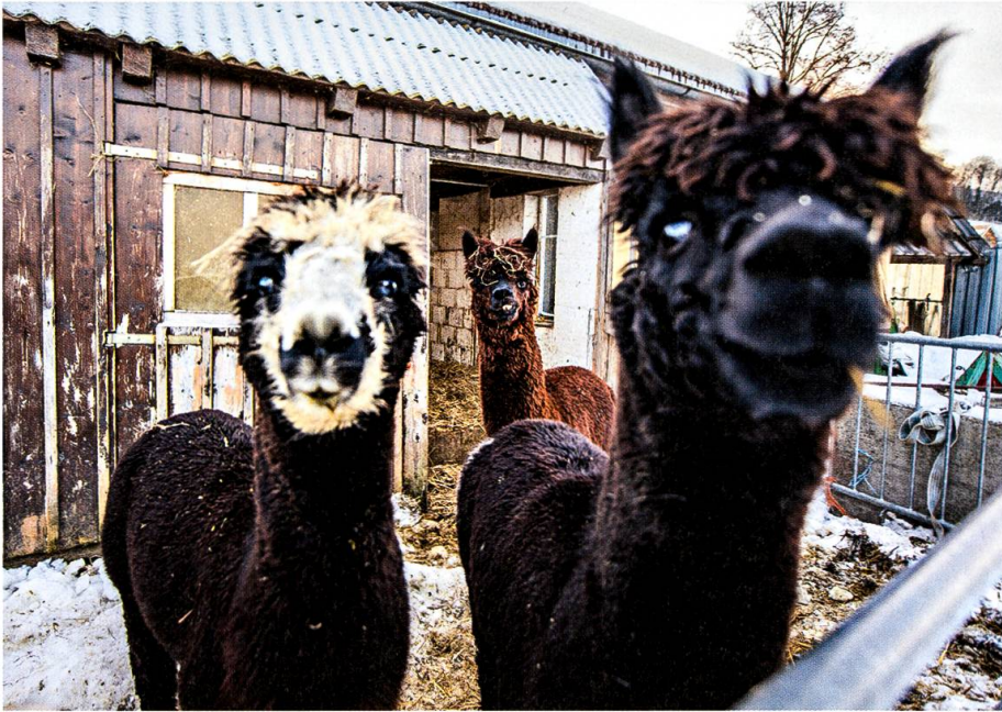
Bilder: Carmen Wueest