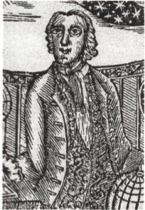
300 Jahre Appenzeller Kalender: mehr als ein Presseerzeugnis, S. 53