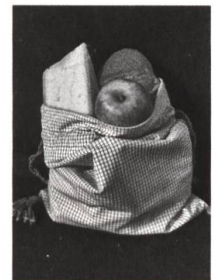
Nähanleitung für einen Reisebeutel, S. 79