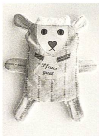
Stääsack selber machen, S. 83