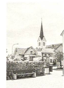
Rundgang durch Oberegg und Reute, S. 88