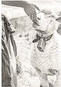
Die Alpzeit im Alpstein hält die Schafe fit, S. 53