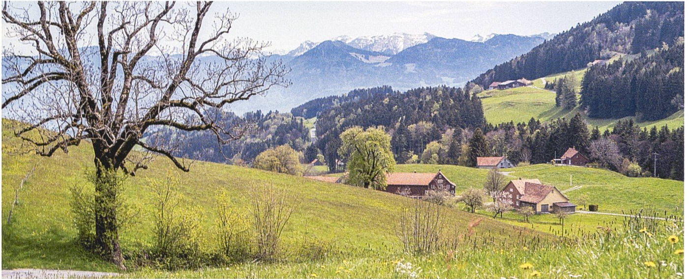
Aussicht vom Vorderdorf, Oberegg.