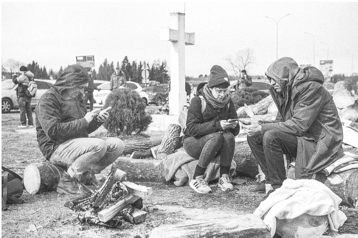
Ukrainische Flüchtlinge im polnischen Grenzgebiet bei Hrebenne am 1. März 2022.