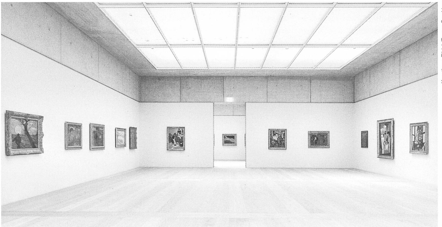
Kunsthaus Zürich/Franca Candrian

sich zu Wort, um die Sammlung mit «Raubkunst»-Unterstellungen und angeblichen Enthüllungen über die Person des 1956 verstorbenen Waffenfabrikanten ins Zwielficht zu rücken. So sehr, dass selbst amerikanische Medien die Story aufgriffen (die New York Times etwa unter dem reisserischen Titel: «A Nazi Legacy haunts a Museum's New Galleries»). Dabei konnten Bührle auch in neuesten historischen Untersuchungen weder Vergehen noch besondere Verbindungen zu Nazi-Deutschland nachgewiesen werden, und bei keinem einzigen Werk der Sammlung erhärtete sich bisher ein «Raubkunst»-Vorwurf. Eine für Zürich und die Schweiz vielleicht nicht untypische Geschichte!