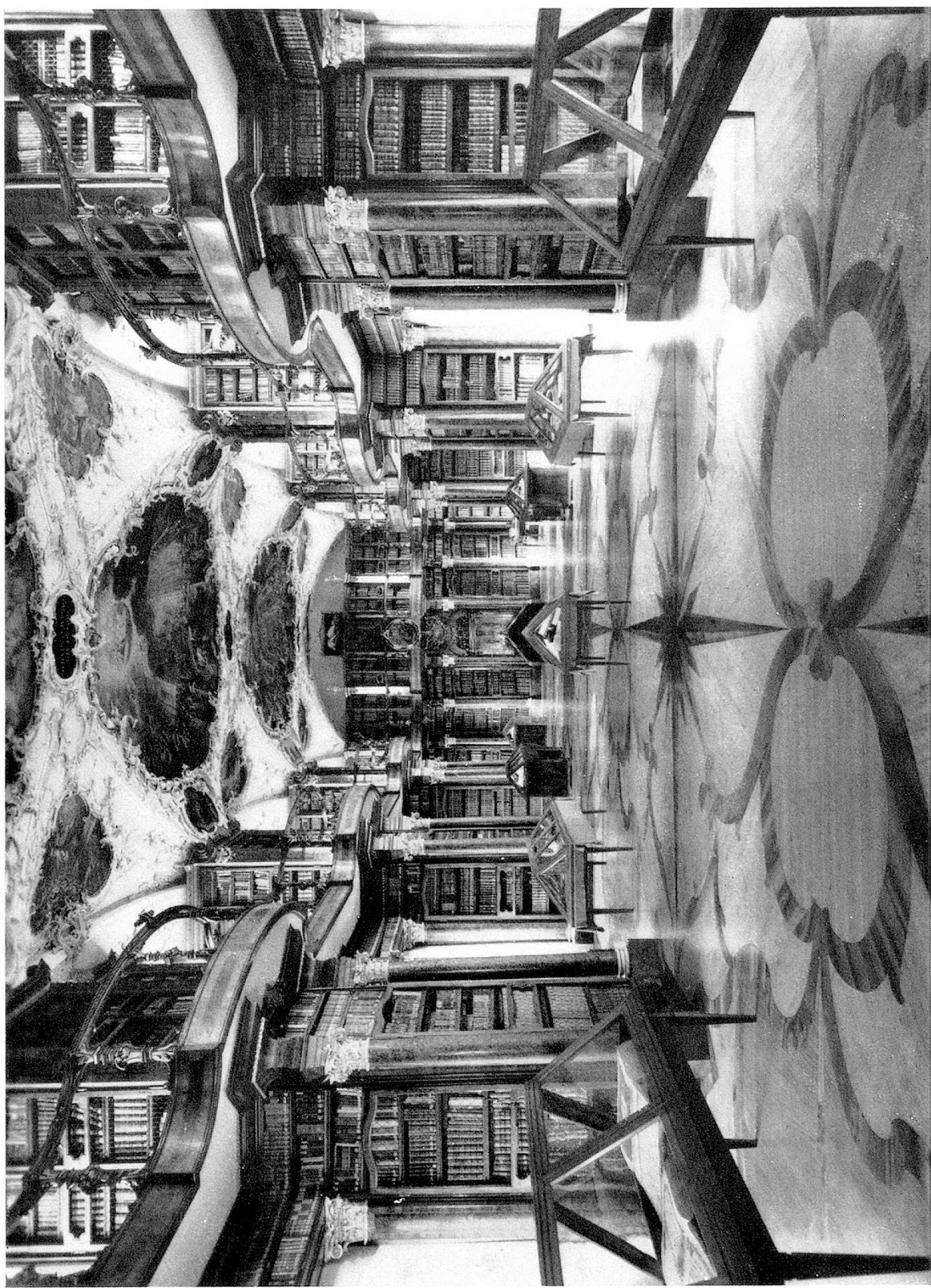
Barocksaal der Stiftsbibliothek St. Gallen, erbaut 1758—1767