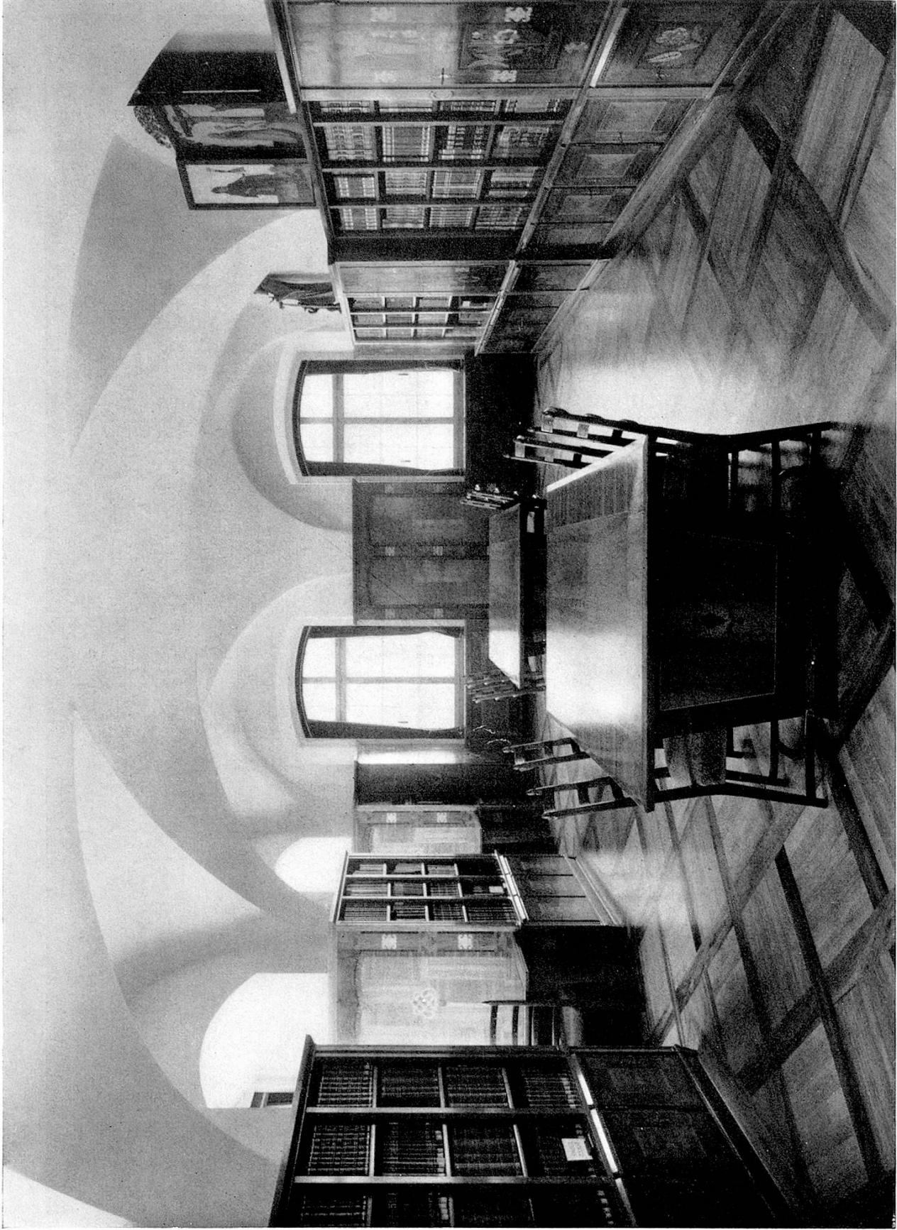
Lesesaal der Stiftsbibliothek St. Gallen, erbaut in der Mitte des 18. Jahrhunderts, renoviert und möbliert 1950