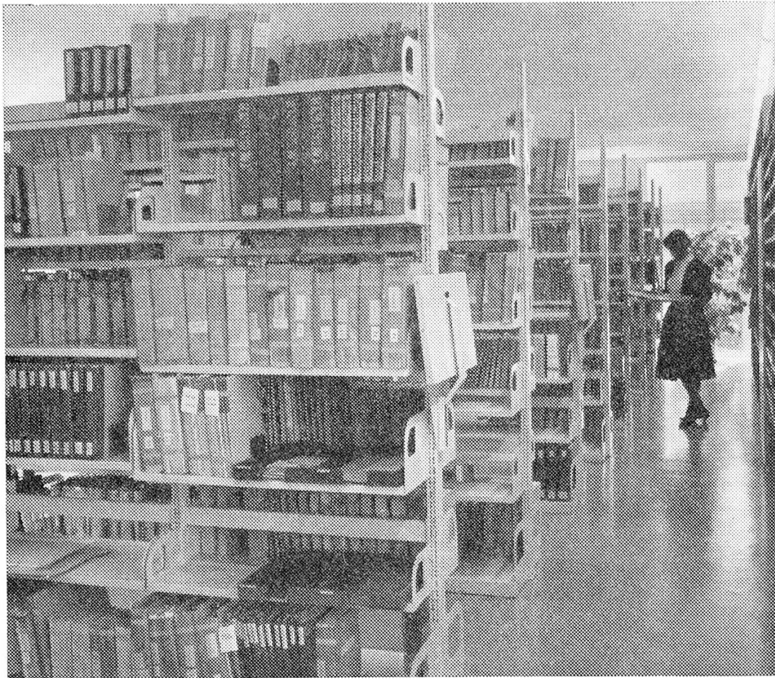
Neubau des Betriebswissenschaftlichen Instituts: Bibliothek-Anlage

Unsere Bode-Panzer-Bücherregale entsprechen den heutigen Anforderungen nach Leichtbau-Konstruktion. Sie erfüllen alle Voraussetzungen in statischer Hinsicht und geben der Einrichtung ein architektonisch ansprechendes Gesicht.