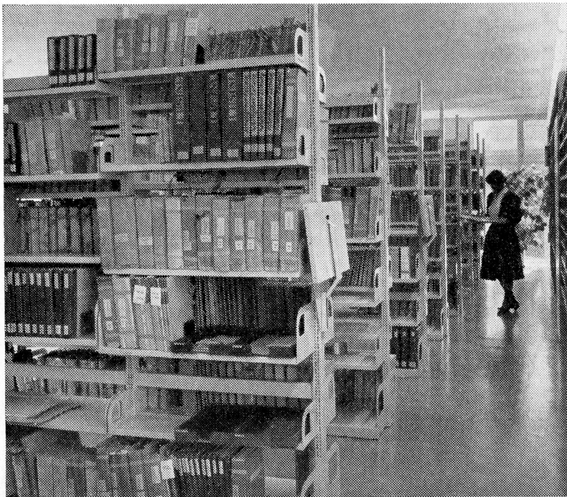
Neubau des Betriebswissenschaftlichen Instituts: Bibliothek-Anlage

Unsere Bode-Panzer-Bücherregale entsprechen den heutigen Anforderungen nach Leichtbau-Konstruktion. Sie erfüllen alle Voraussetzungen in statischer Hinsicht und geben der Einrichtung ein architektonisch ansprechendes Gesicht.