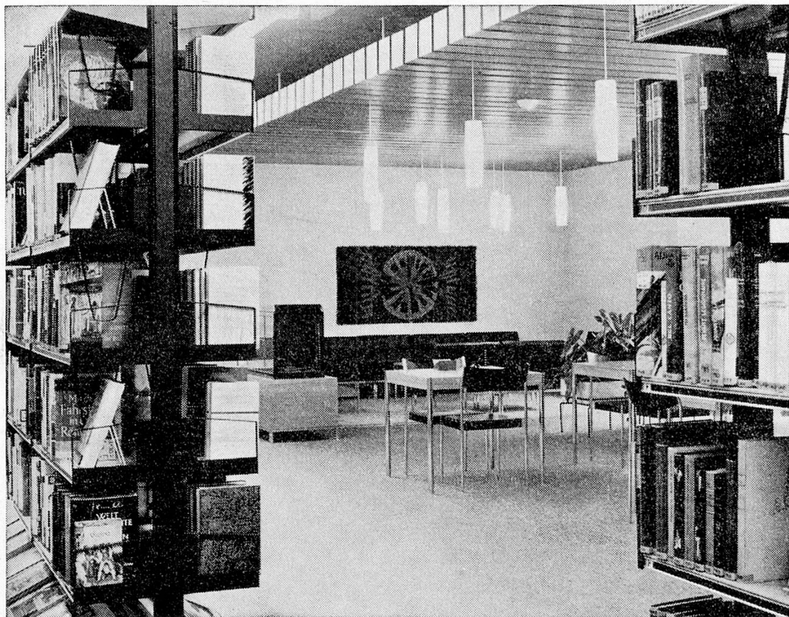
Berner Volksbücherei, Monbijoustraße

Freistehend oder an die Wand montierbar. Beliebige Ergänzung und Kombination der Gestelle, ohne Schrauben verstellbar.