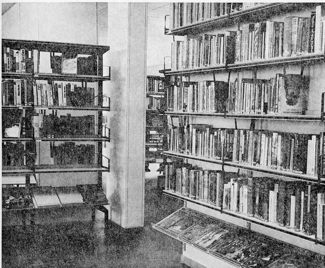
Stadtbibliothek Baden (AG)