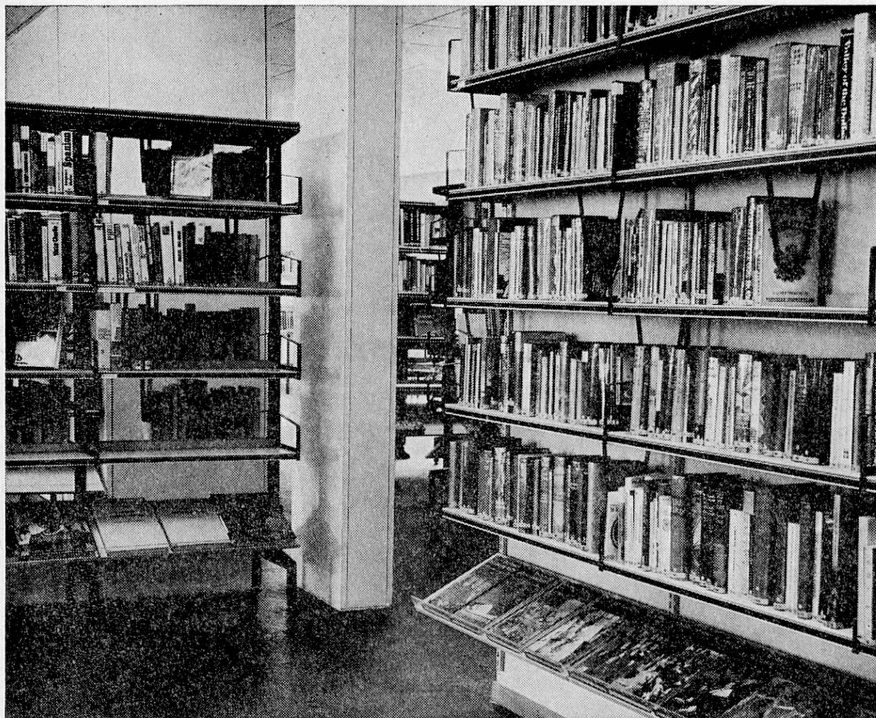
Stadtbibliothek Baden (AG)