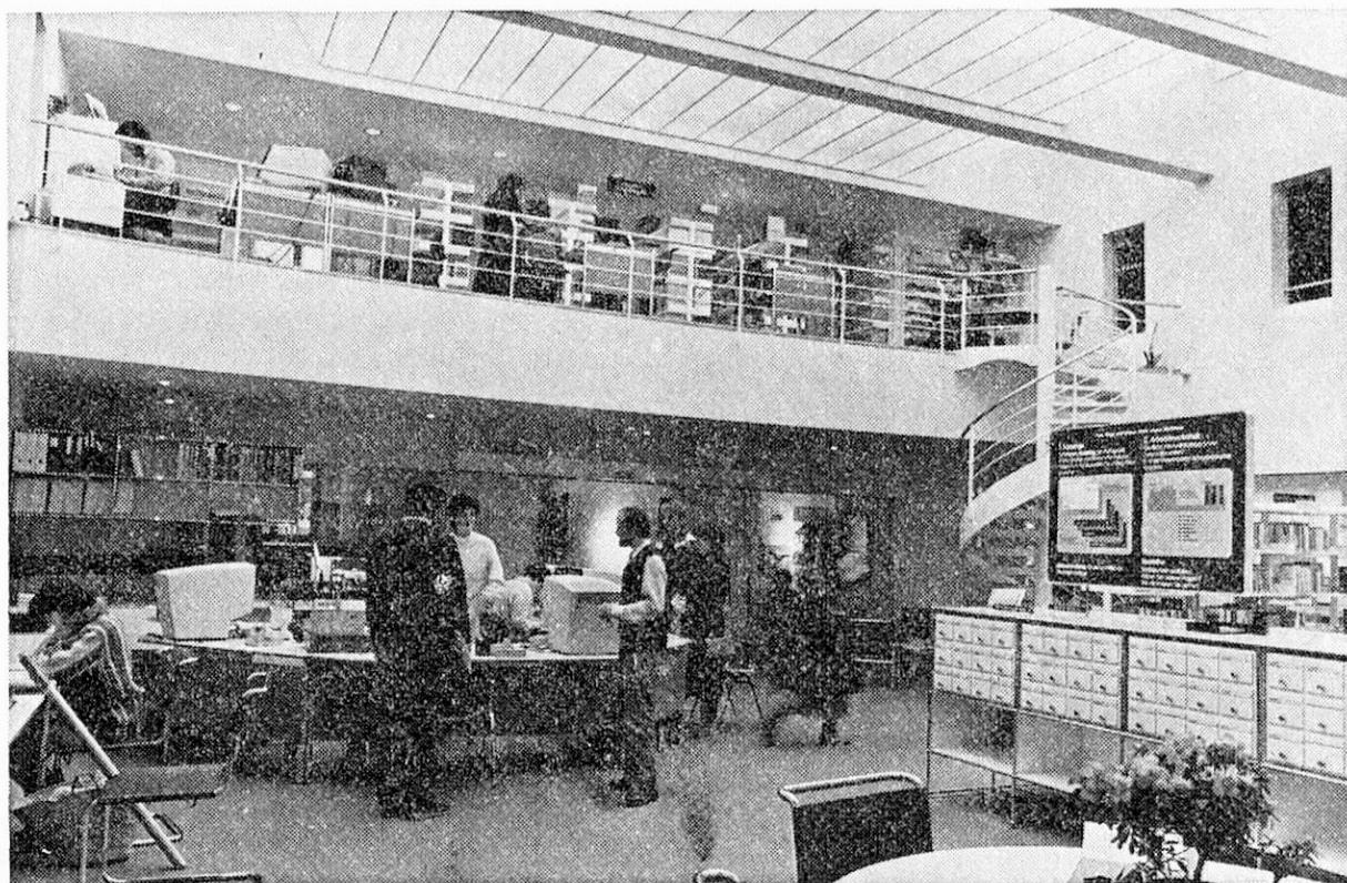
Die neuartige pädagogisch-didaktische Arbeitsmediothek — eine Informationsquelle und ein Arbeitsinstrument für den Lehrer.

Ausbau des Dachgeschosses sowie durch einen aareseitigen, dreigeschossigen Anbau war es möglich, die Bruttogeschoßfläche von 1880\text{ m}^2 auf 2800\text{ m}^2 zu vergrößern. Dies ermöglichte die saubere Zuordnung der vorgesehenen Betriebsfunktionen an bestimmte Gebäudegeschosse: